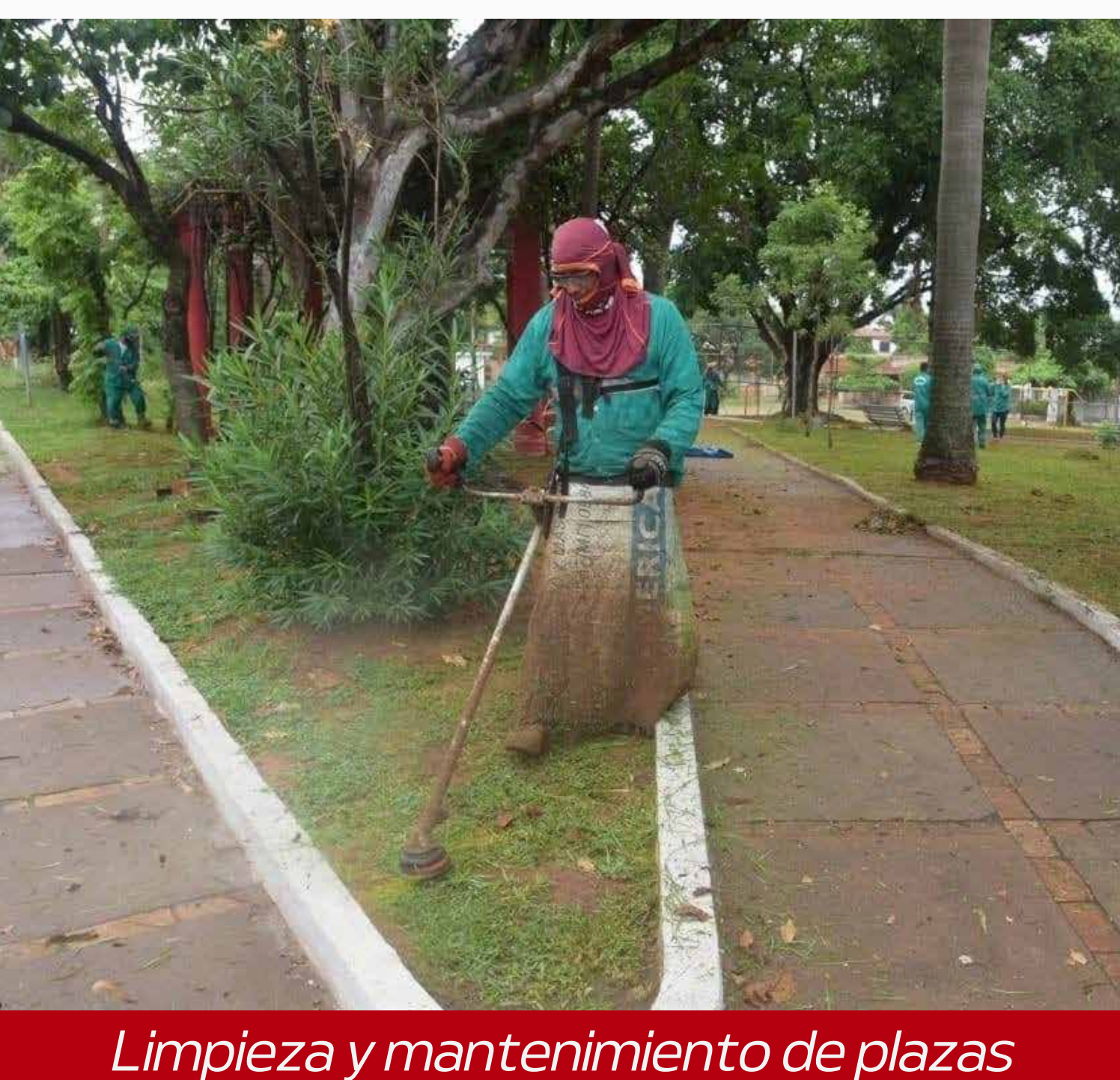
Limpieza y mantenimiento de plazas

Héroes del Chaco, Plaza Bolivia, Plaza de Las Residentas, Plaza Jardín de la Bahía, Paseo Central 17º Proyectada, Plaza Primer Presidente, Plaza Isabel la Católica, Plaza De las Américas, Plaza Infante Rivarola, Plaza Manuel Ortiz Guerrero, Plaza Santa Teresa, Parque Municipal Sergio Denis Insfrán, Paseo Diagonal Cabañas 9º Proyectada, Plazoleta Sargento Gauto, Plaza Lemos Maldonado, Plaza Defensores del Chaco, Plaza De los Comuneros, Plaza Independencia, Plaza IPVU, Plaza Loma Pytã, Plaza Mbocayaty, Plaza Emiliano R. Fernández, Plaza Ycua Ybumi, Plaza Villa Esperanza, Plaza La Golondrina, Plaza Vecinos Unidos, Plaza San José Obrero, Plaza Arsenio Erico, Plaza Vy'a Renda, Plaza Agustín Pío Barrios, Plaza Agricultor Paraguayo, Plaza Darío Gómez Serrato, Plaza República del Perú, Plaza Oñondivepá, Plaza Las Colinas, Plaza El Portal.