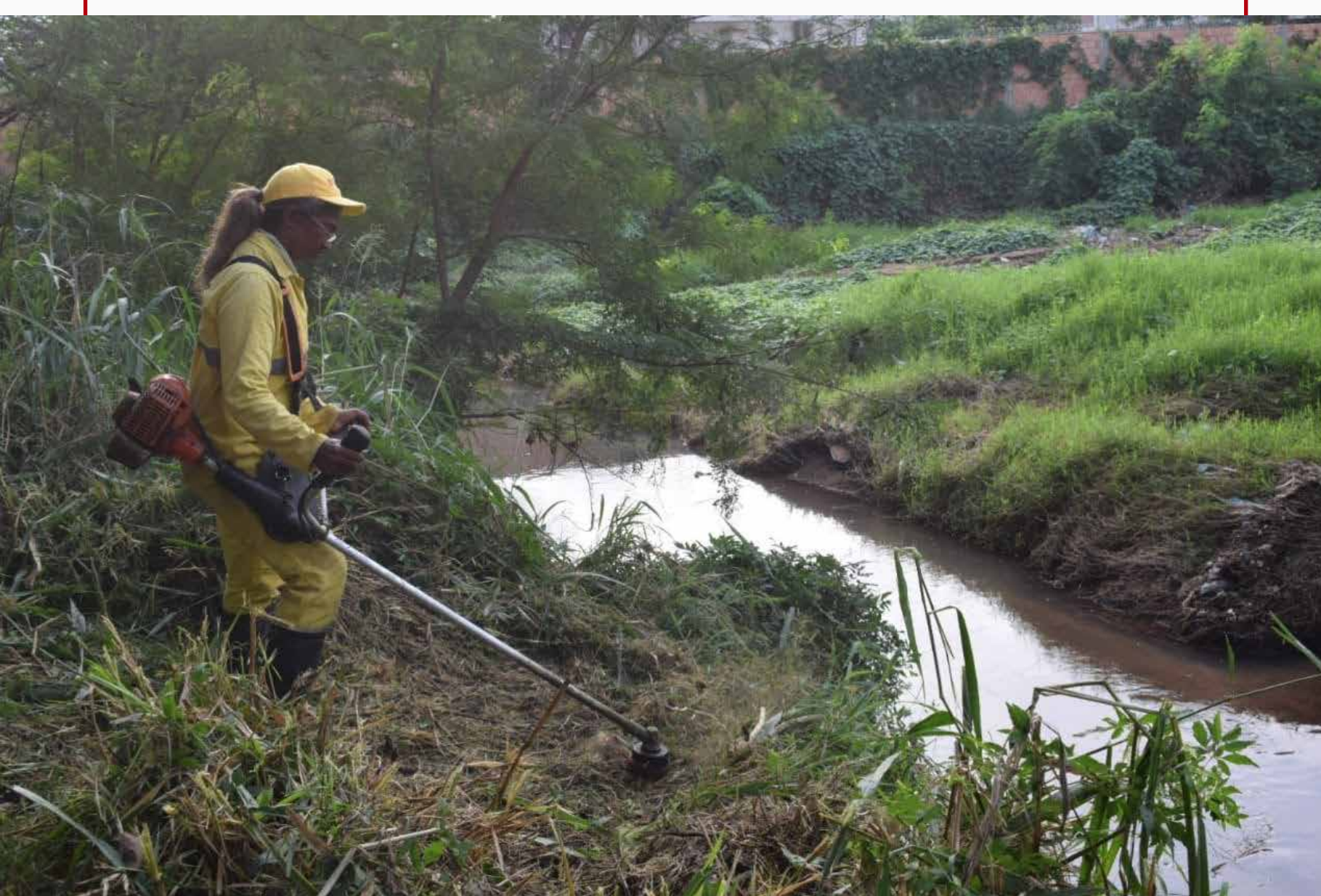
Limpieza de arroyos