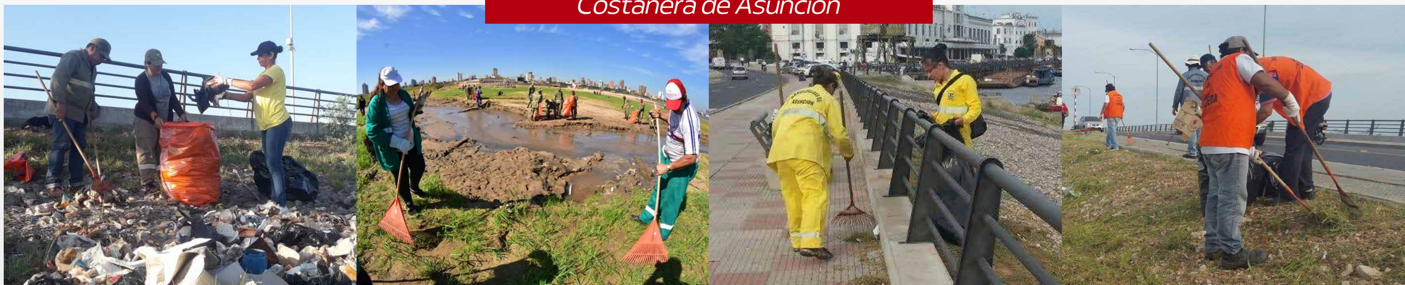
Costanera de Asunción