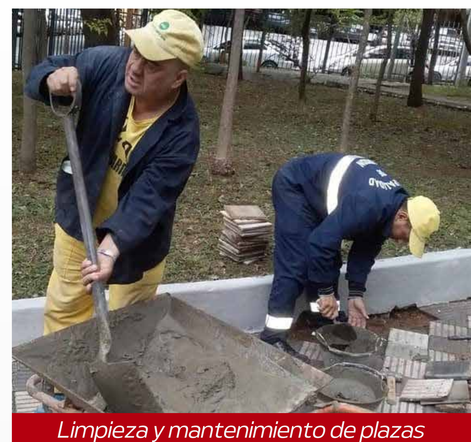
Limpieza y mantenimiento de plazas