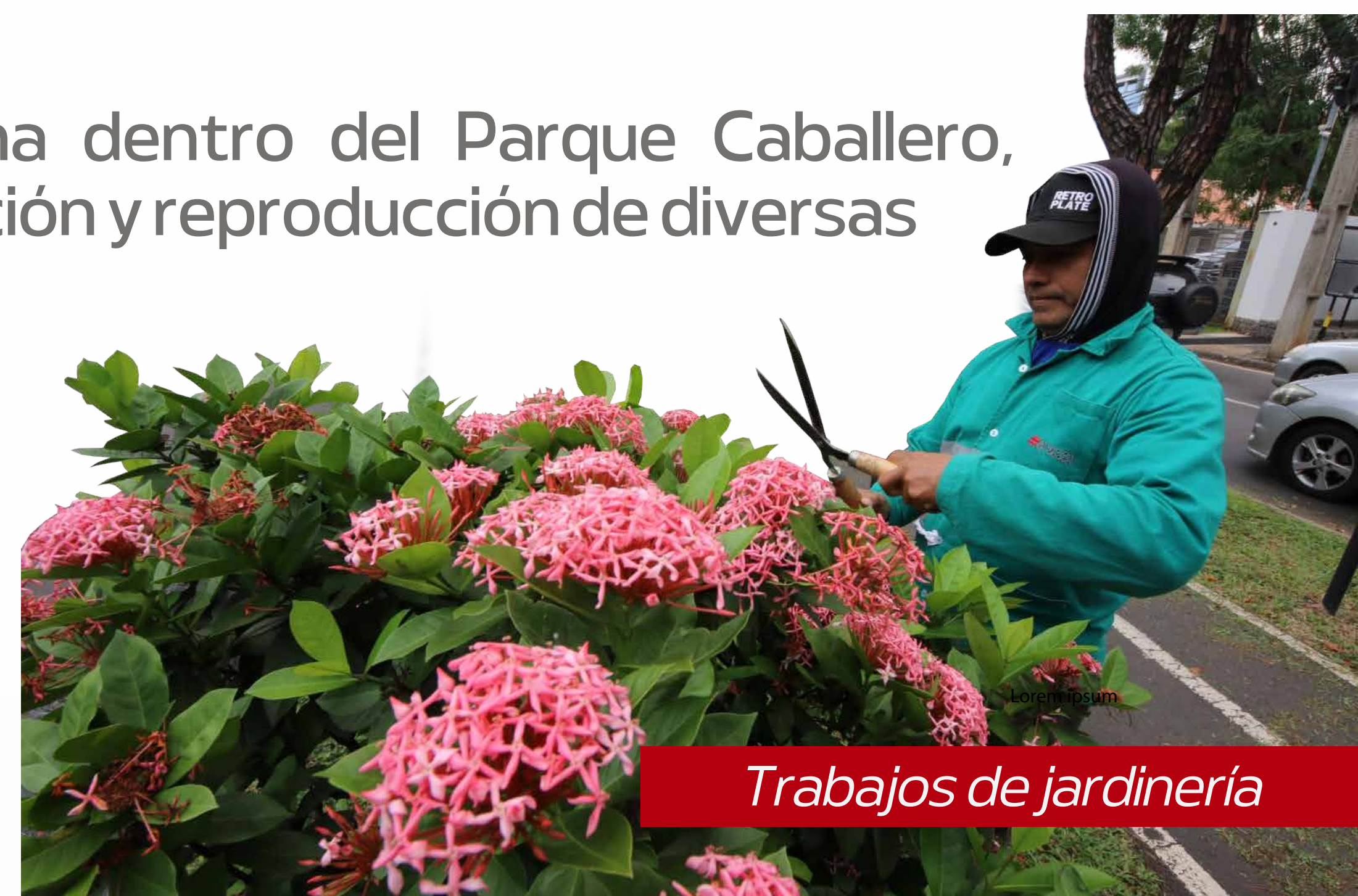
Trabajos de jardinería

Ejecutamos exhaustivos trabajos de limpieza integral en la Autopista Ñu Guazú, para colaborar con el Ministerio de Obras Públicas y Comunicaciones (MOPC). El operativo de limpieza incluyó el apoyo con maquinarias para la intervención integral del tramo que se extiende desde la Ruta Transchaco, a la altura del Jardín Botánico, hasta el Arroyo Itay, que equivale a más de 3 kilómetros de extensión.