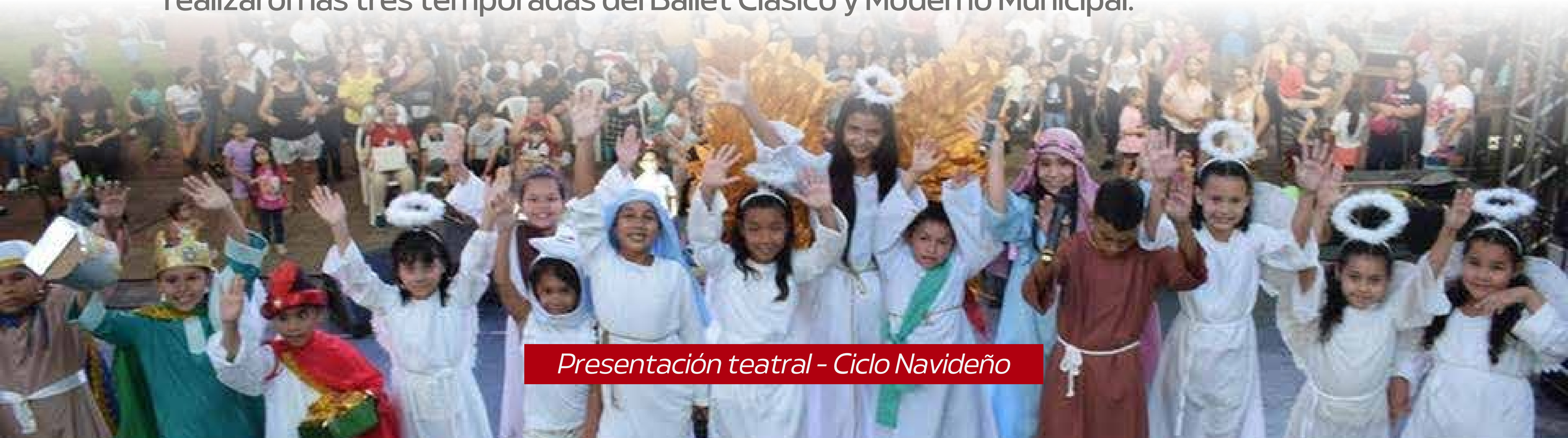
Presentación teatral - Ciclo Navideño

Asimismo, hemos tenido ciclos de conciertos de temporada y al aire libre en los diferentes barrios, con las actuaciones de la Orquesta Sinfónica de la Ciudad de Asunción (OSCA) y de la Orquesta de Cámara de la Municipalidad de Asunción (OCMA). Así también se realizaron las tres temporadas del Ballet Clásico y Moderno Municipal.