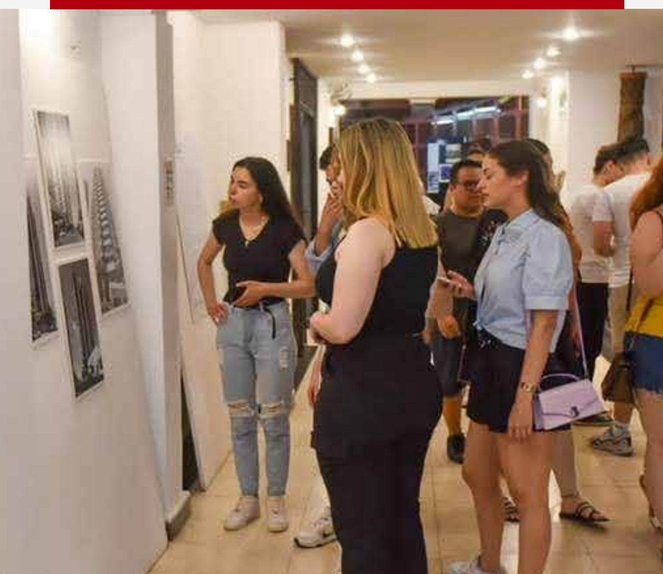
Noche de museos