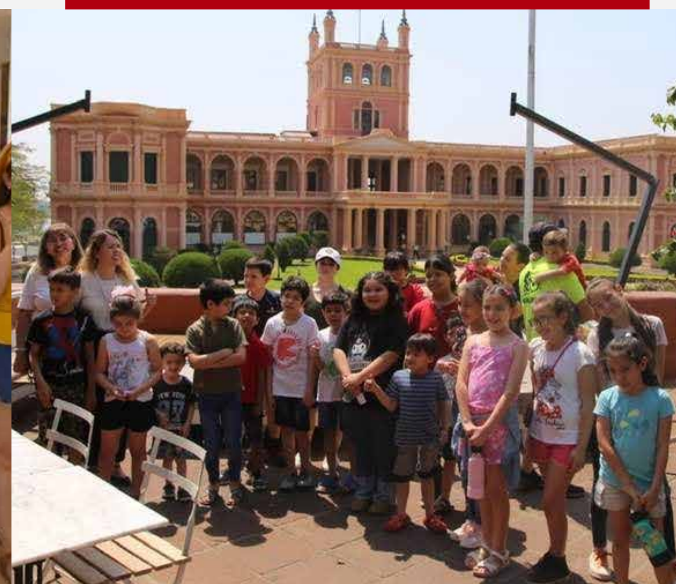
Museólogos por un día