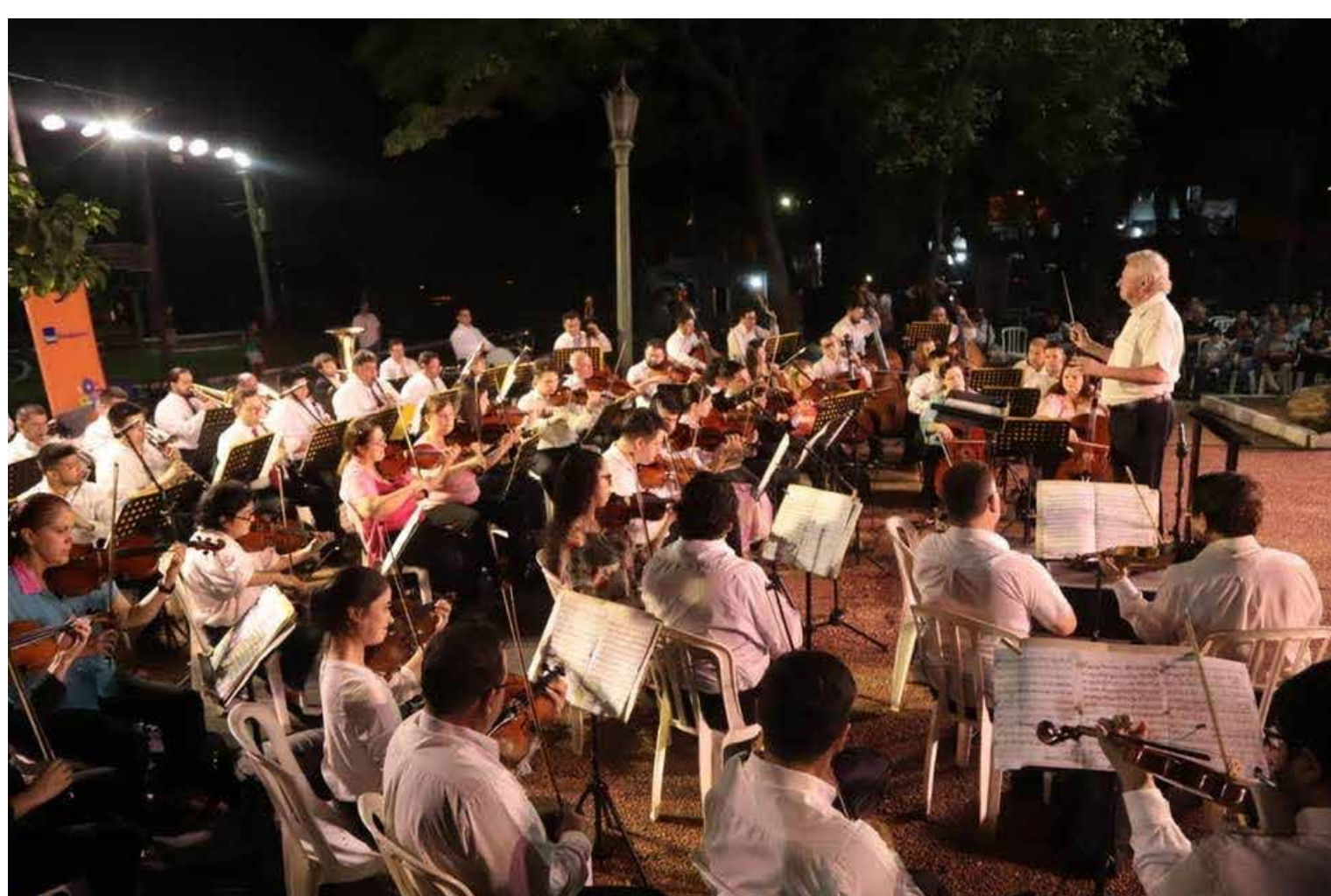
Orquesta Sinfónica de la Ciudad de Asunción

Es así que organizamos diferentes espectáculos que se desarrollaron en nuestros espacios culturales, llevando a cabo diversas actividades, y mencionamos las más relevantes: ciclo de verano, semana santa, festejos patrios, festivales de San Juan, por el mes del folklore, la guarania y el aniversario de Asunción, que incluyeron feria de libros y artesanías, presentaciones artísticas en primavera, el Asu Jazz, el Ciclo Navideño y la apertura de verano con un gran concierto en la Costanera de Asunción, que le dio color al cierre del año 2023.