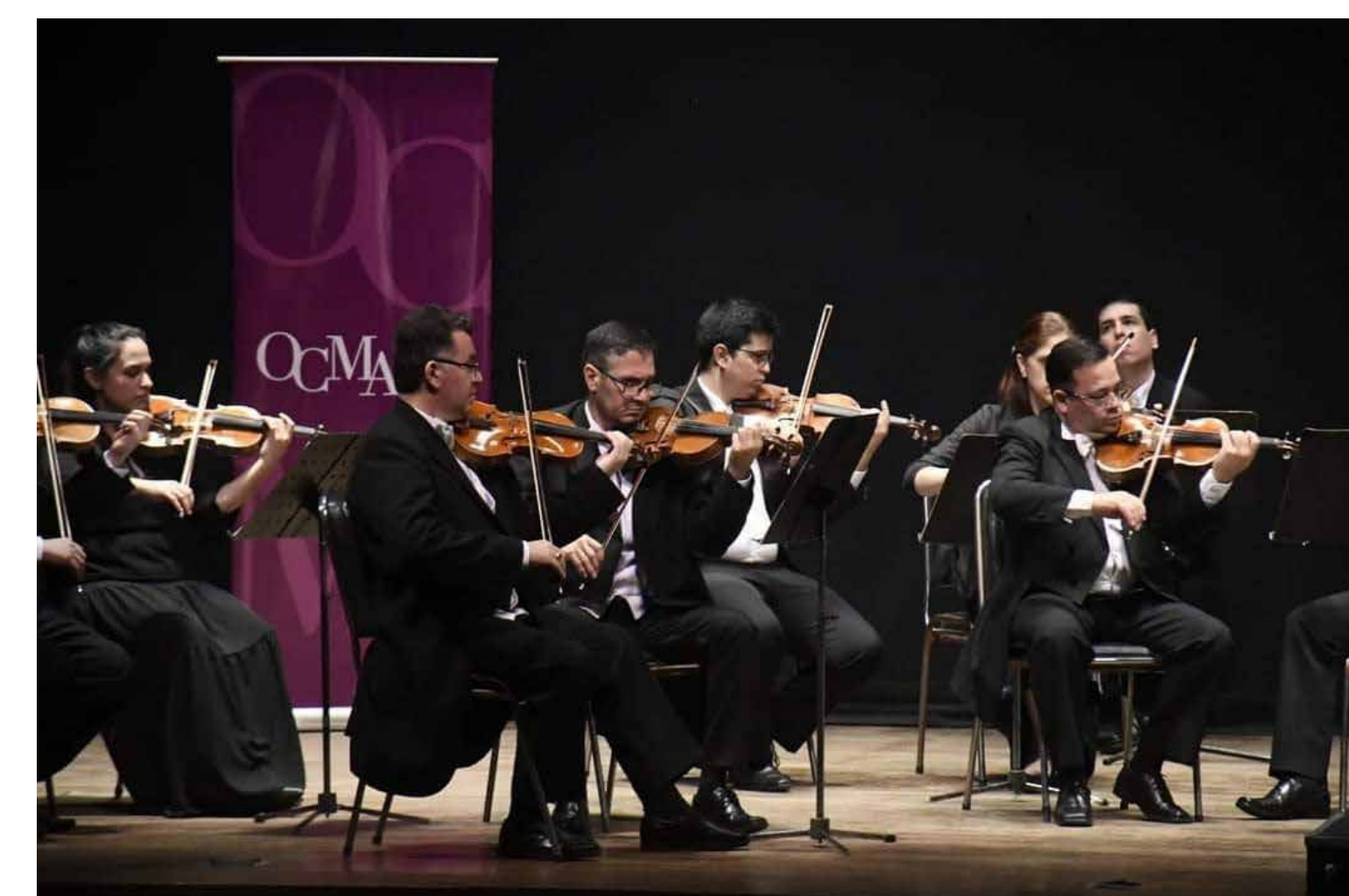
Orquesta de Cámara de la Municipalidad de Asunción

En el Teatro Municipal Ignacio A. Pane destacamos estas actividades y público en teatro abierto con las obras "Dramatour", "Desenchufate", "Habitando el Teatro" e intervenciones artísticas varias con un total de 1.370 participantes. Fueron realizadas más de 27 actividades en las salas Ignacio A. Pane y Baudillo Alió, con más de 71.000 personas.