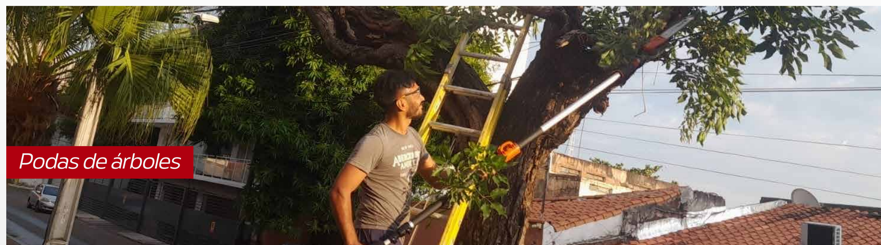
Podas de árboles