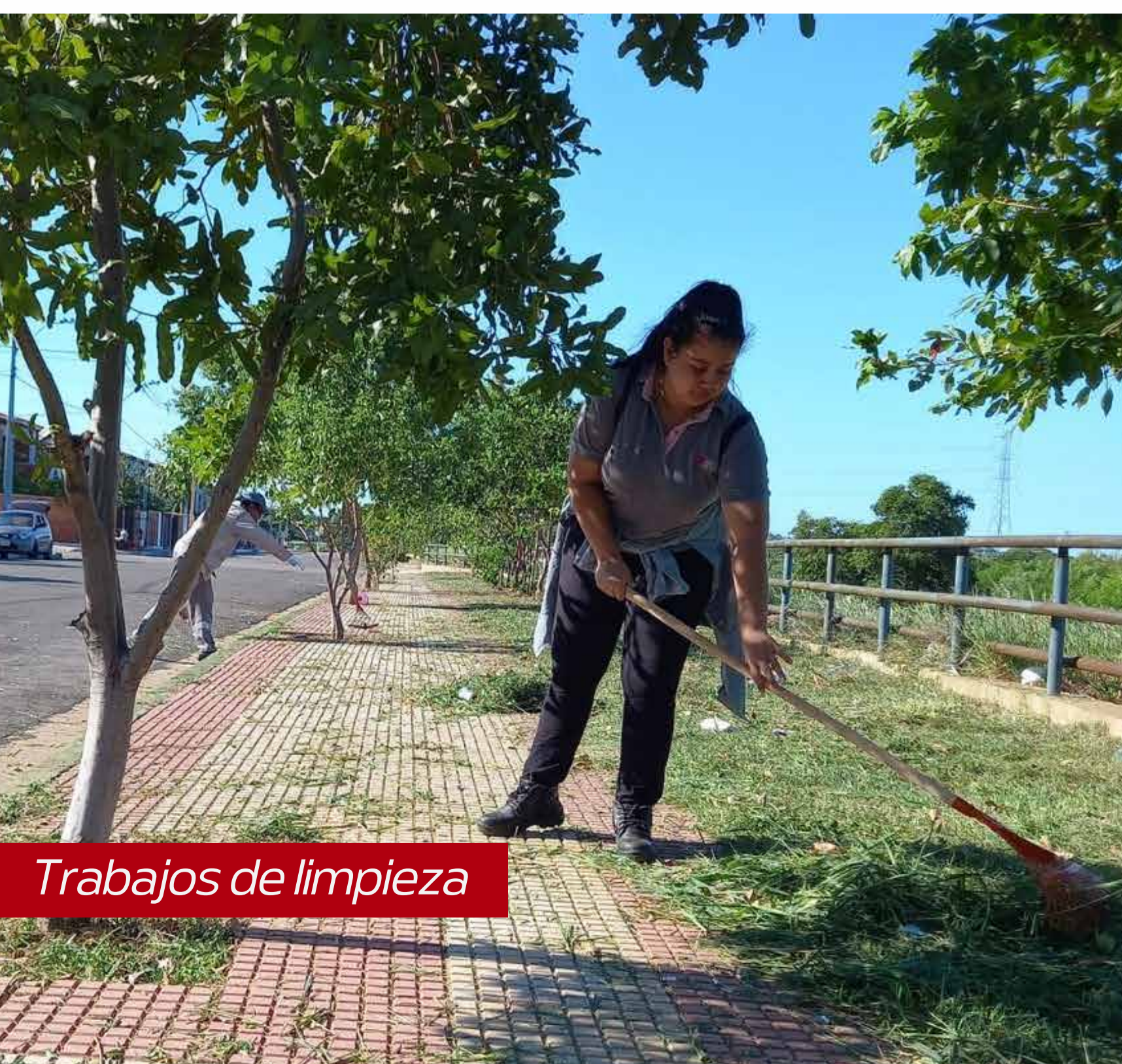
Trabajos de limpieza