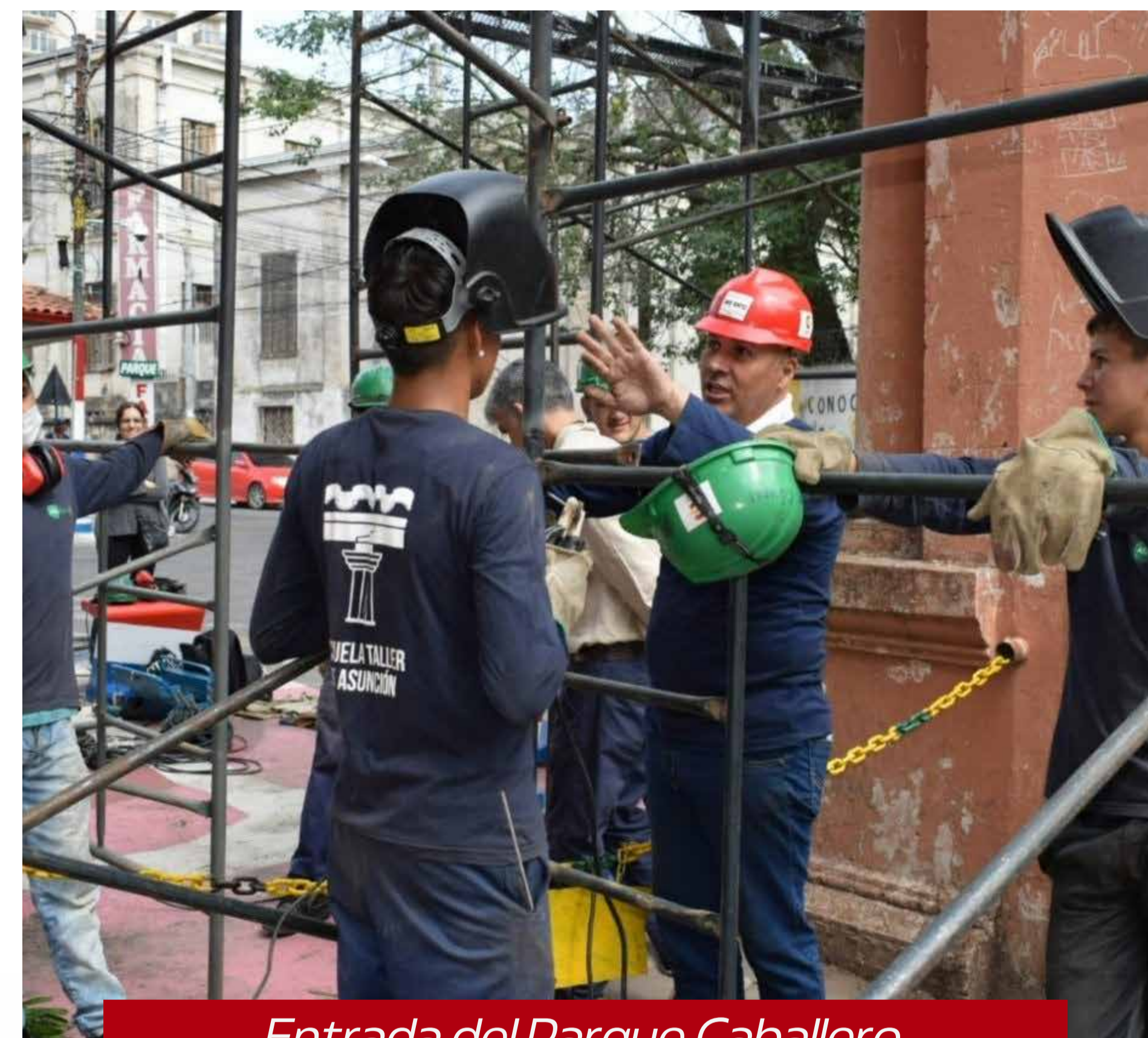
Entrada del Parque Caballero Alumnos de la Escuela Taller de Asunción