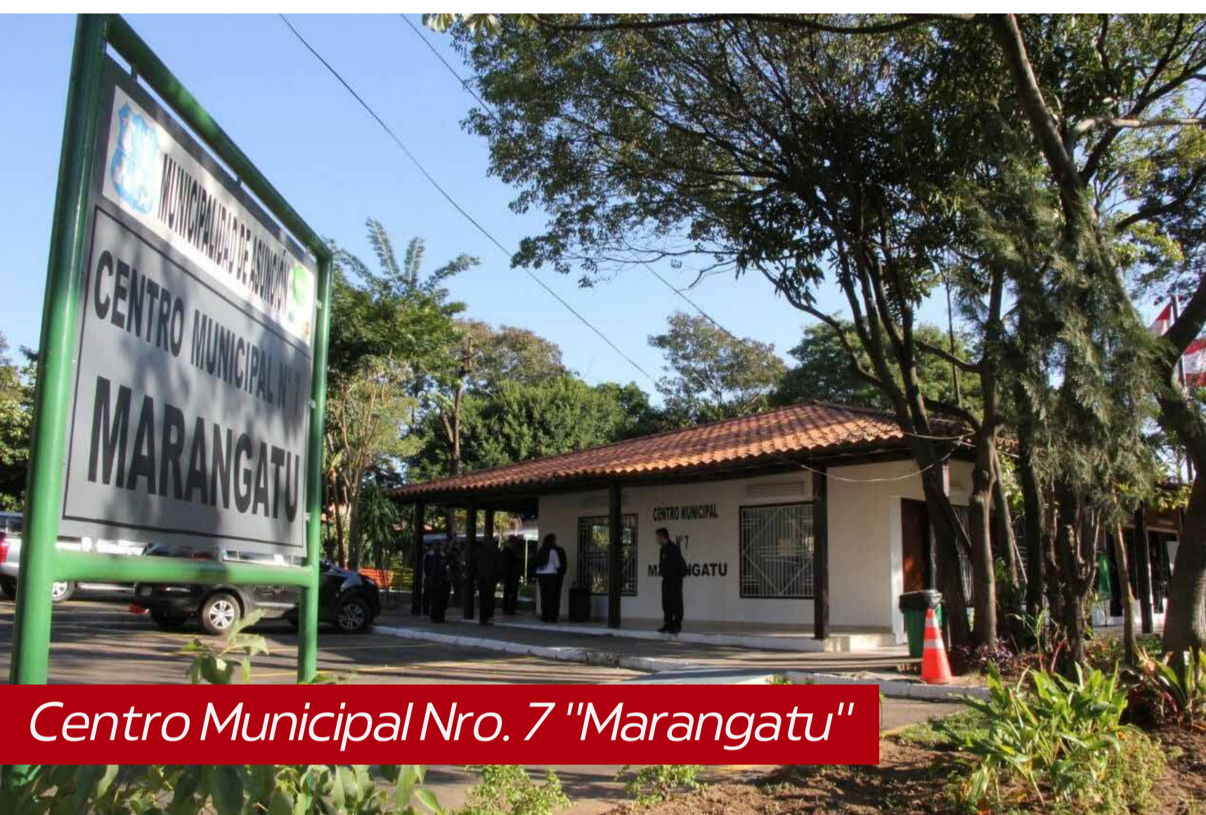
Centro Municipal Nro. 7 "Marangatu"

Llevamos a cabo un total de 10 ferias de economía solidaria, 96 gestiones con la ESSAP y 39 operaciones conjuntas con la ANDE, 114 actividades culturales, 476 cursos y 40 actividades deportivas.