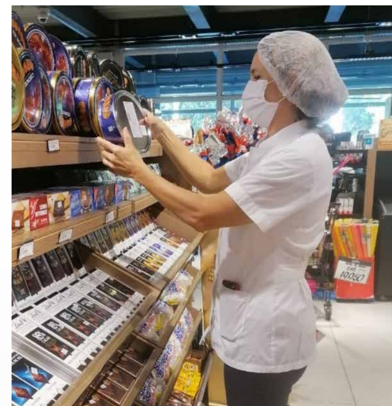
Inspección de productos

Las mediaciones también estuvieron al orden del día, realizadas de forma presencial, vía telefónica y email, mediante la recepción de expedientes, seguimientos, notificaciones y visitas a locales comerciales, llevando 64 casos de mediación y 114 controles de locales para la verificación de oferta de precios y pesos.