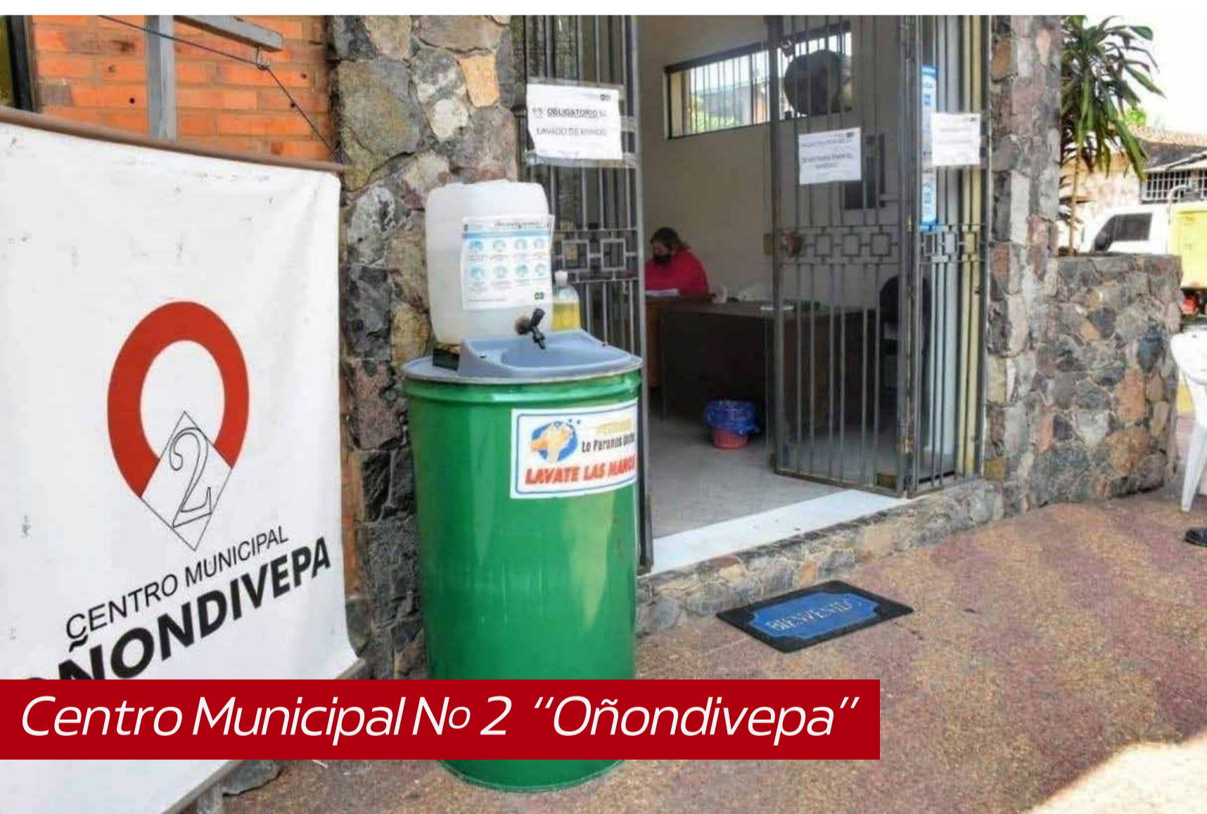
Centro Municipal No 2 "Oñondivepa"