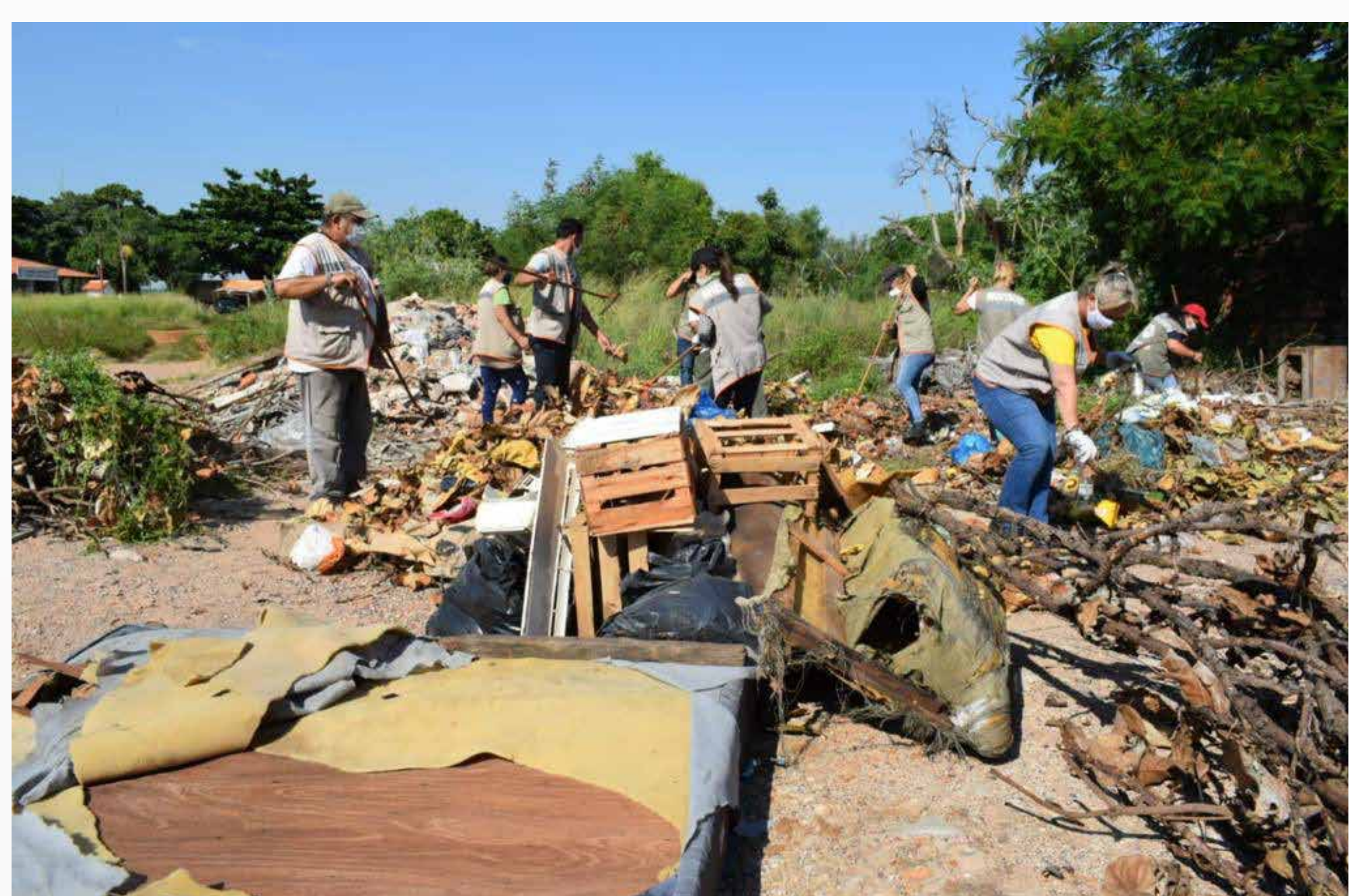
Vertederos clandestinos operativo Verano sin Dengue

La pandemia generada por el COVID-19 ha causado estragos, sobre todo a la población más vulnerable y también tuvimos que lidiar con la ola de influenza, dengue y chikungunya.