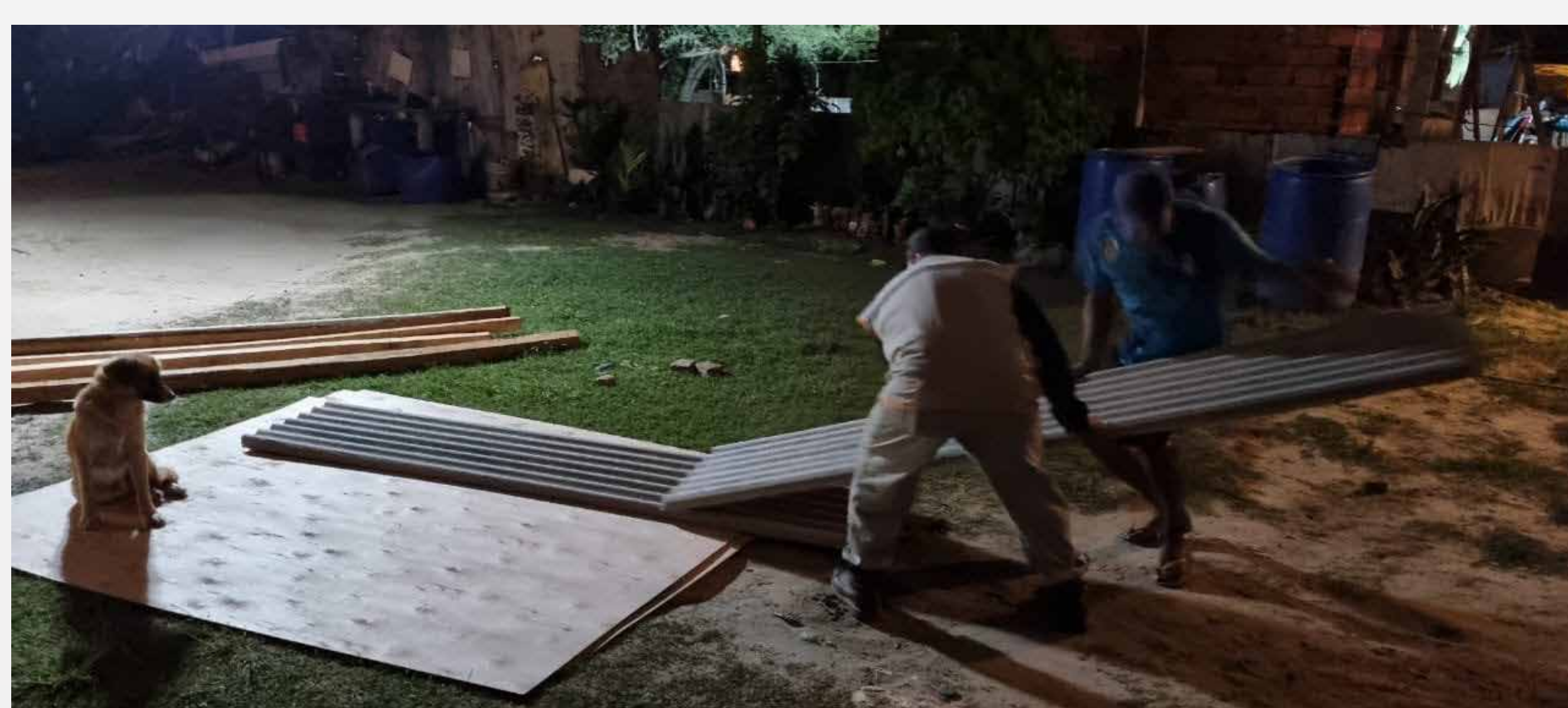
Asistencia a familias por el temporal