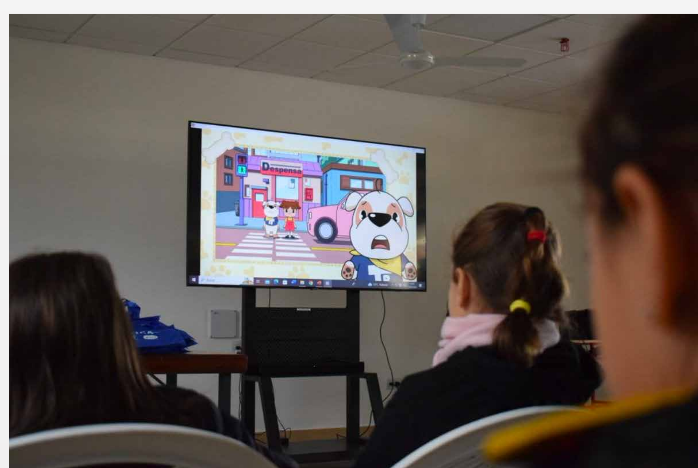
Educación vial en colegios

Por otra parte, mediante un convenio con otros municipios, implementamos el plan de formación de futuros policías municipales.