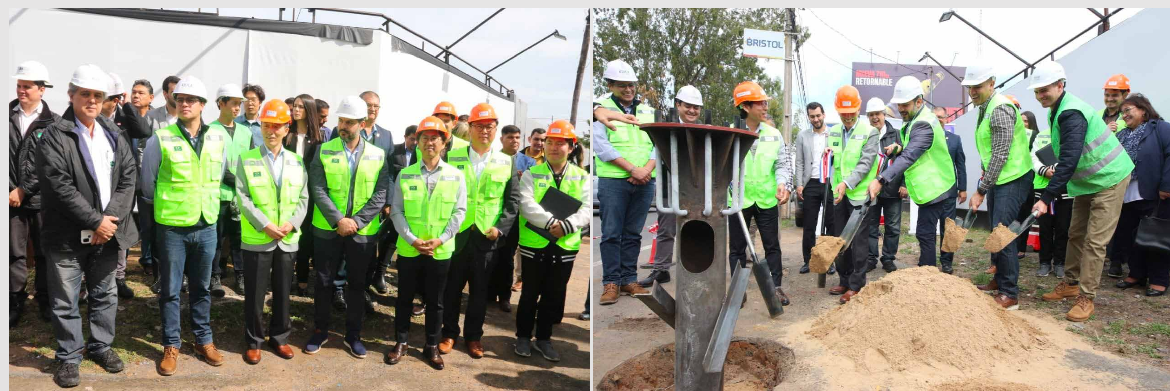
Nuevos semáforos para Asunción

Para ese efecto se ha cumplido con todos los requisitos exigidos por la Ley 5016/14 "Nacional de Tránsito y Seguridad Vial", para la impresión y emisión de licencias de conducir, hecho que coloca a la licencia emitida por la Municipalidad de Asunción entre las más prestigias del país, por el nivel de exigencia para su obtención.