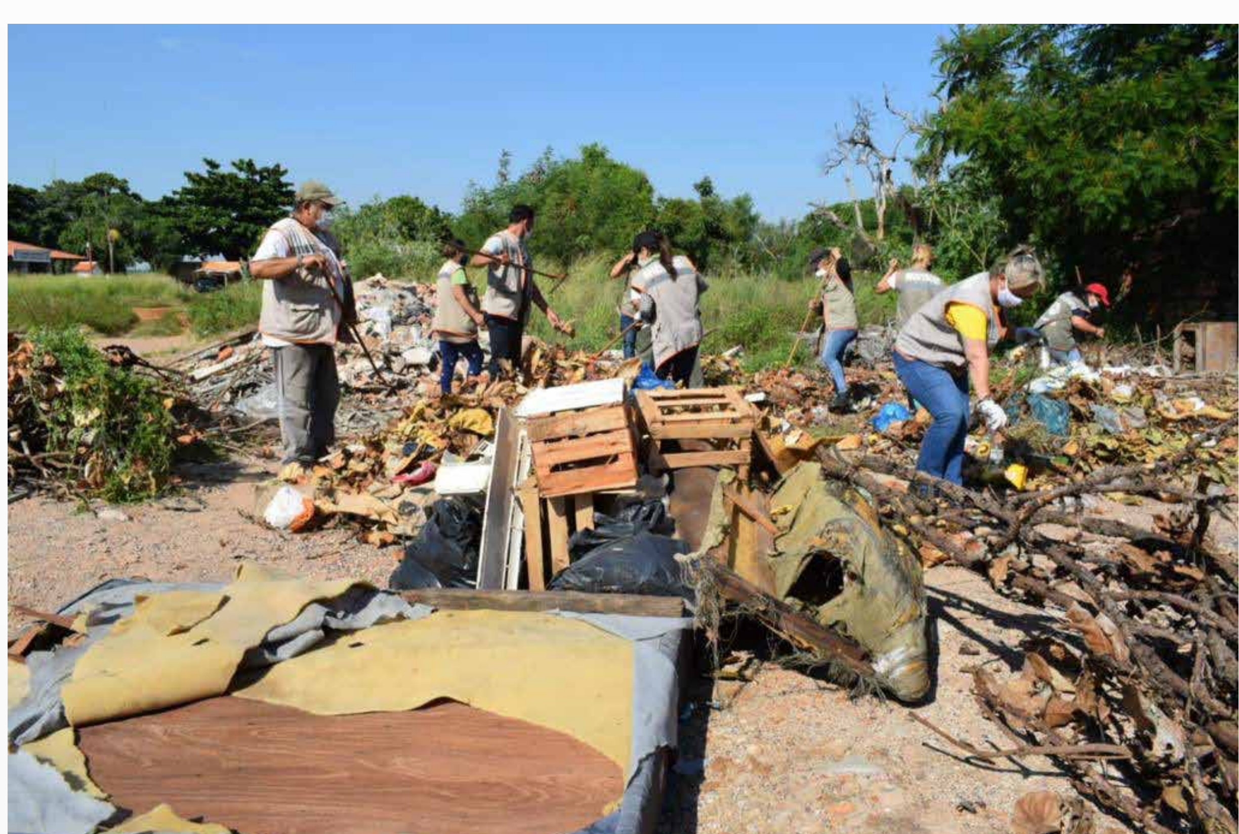
Vertederos clandestinos operativo Verano sin Dengue

La pandemia generada por el COVID-19 ha causado estragos, sobre todo a la población más vulnerable y también tuvimos que lidiar con la ola de influenza, dengue y chikungunya.