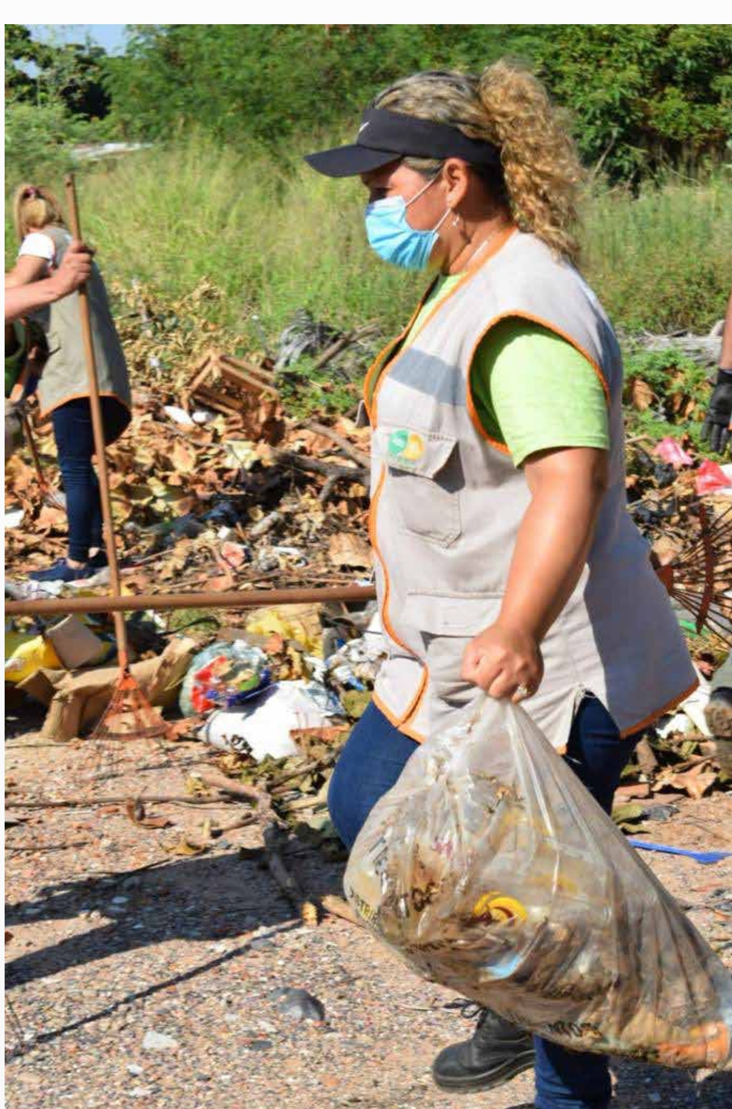
Limpieza de baldíos

La pandemia generada por el COVID-19 ha causado estragos, sobre todo a la población más vulnerable y también tuvimos que lidiar con la ola de influenza, dengue y chikungunya.