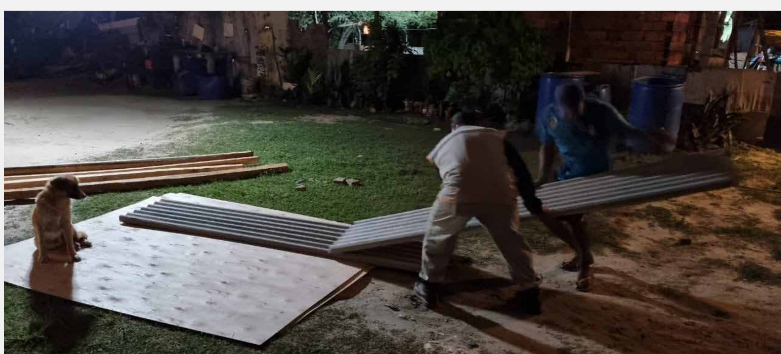
Asistencia a familias por el temporal