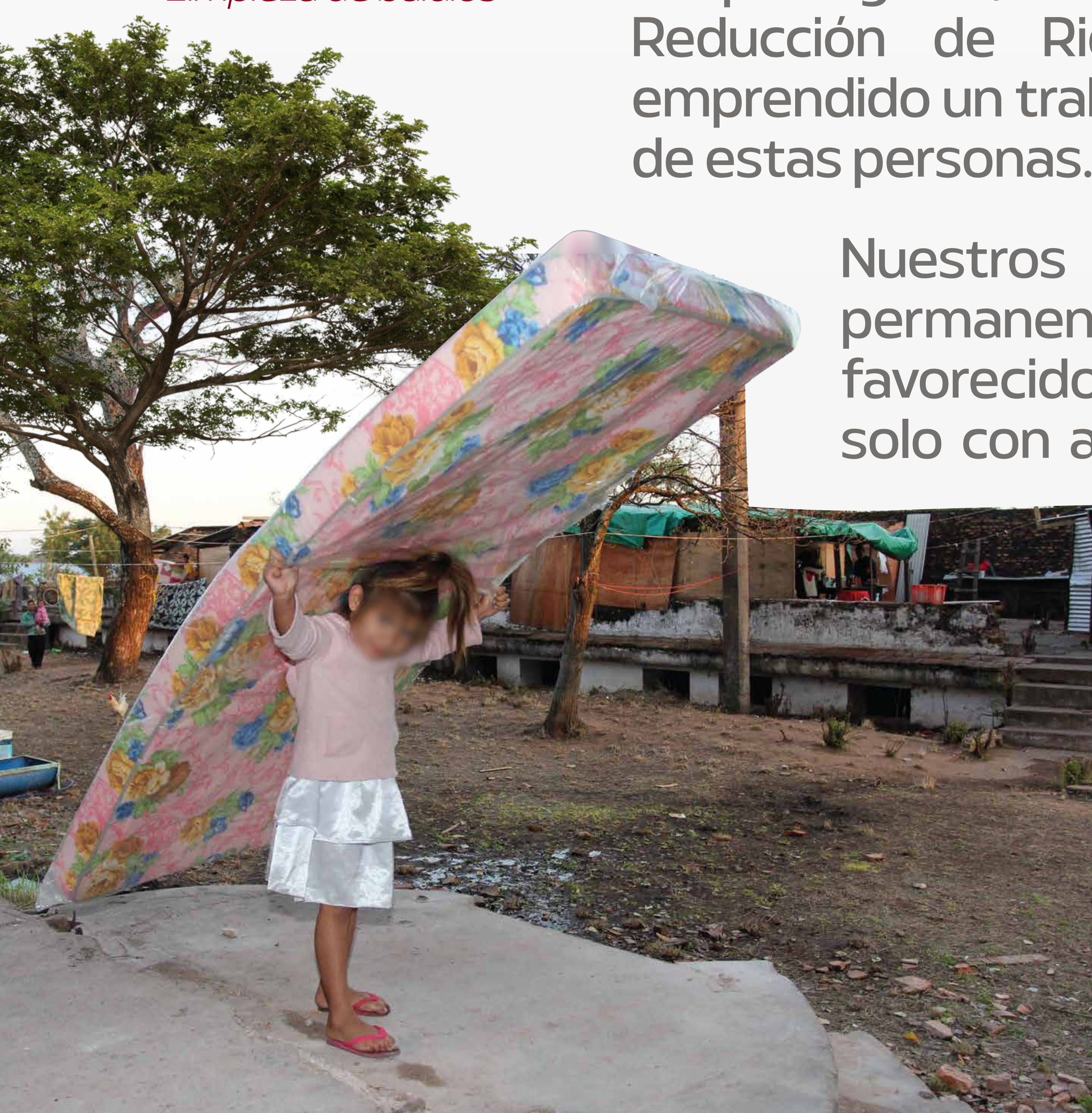
Asistencia a familias - Gestión de Riesgos

En el afán de velar por nuestros ciudadanos más desprotegidos, la Dirección General de Gestión y Reducción de Riesgos de Desastres (DGRRD), ha emprendido un trabajo maratónico para acudir al servicio de estas personas.