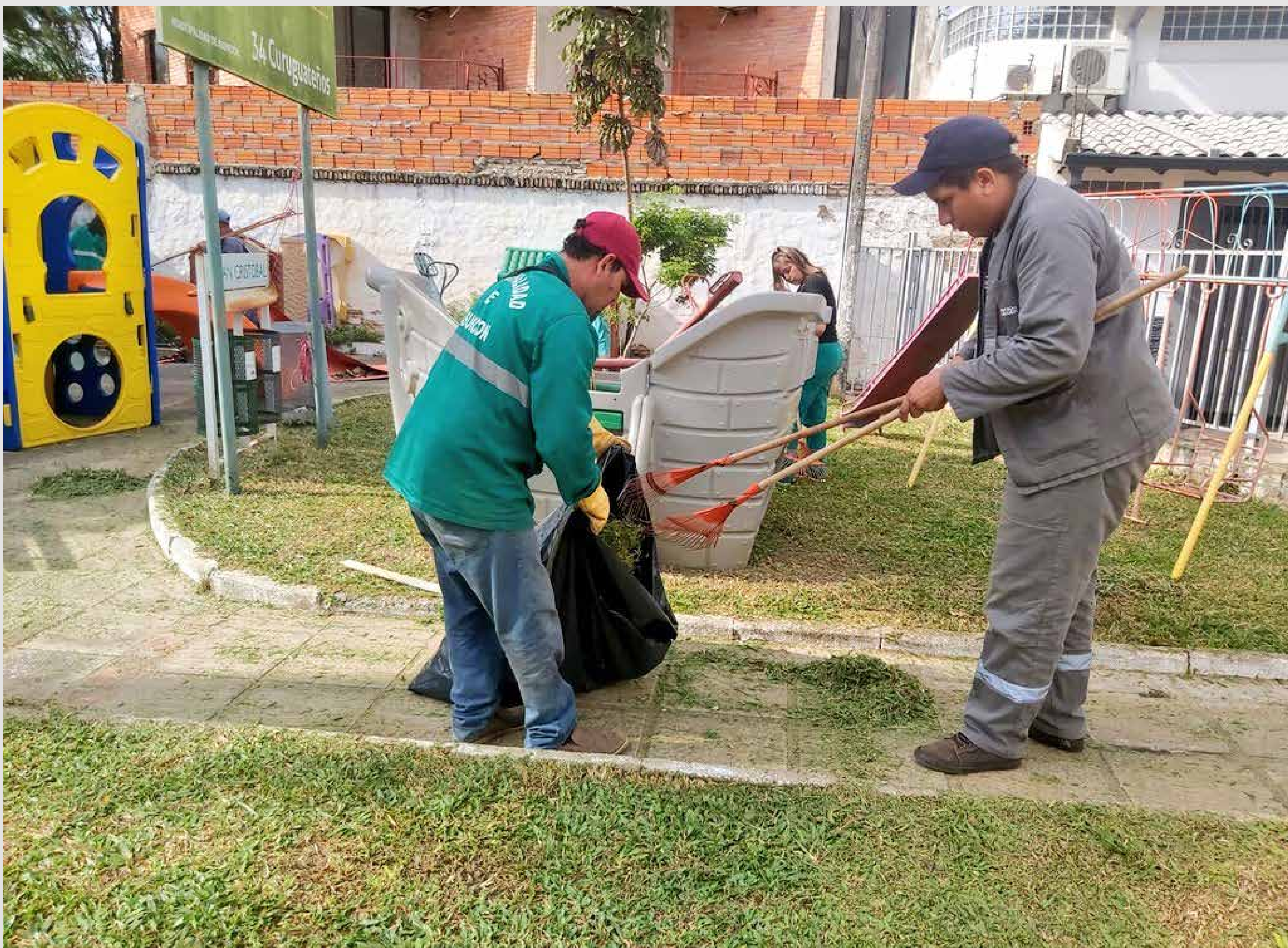
Limpieza y revitalización de plazas

Por otra parte, con la colaboración de los funcionarios de Servicios Urbanos, logramos la recuperación y revitalización de varias plazas, en especial la Plaza Uruguay y la del Cabildo, a fin de que la ciudadanía tenga un espacio confortable para recrearse, esto en el marco del proyecto “Plaza para la gente”, en donde se contempla la reparación del mobiliario urbano, de los juegos infantiles, la renovación lumínica, trabajos de albañilería y todo lo necesario para el bienestar de los contribuyentes.