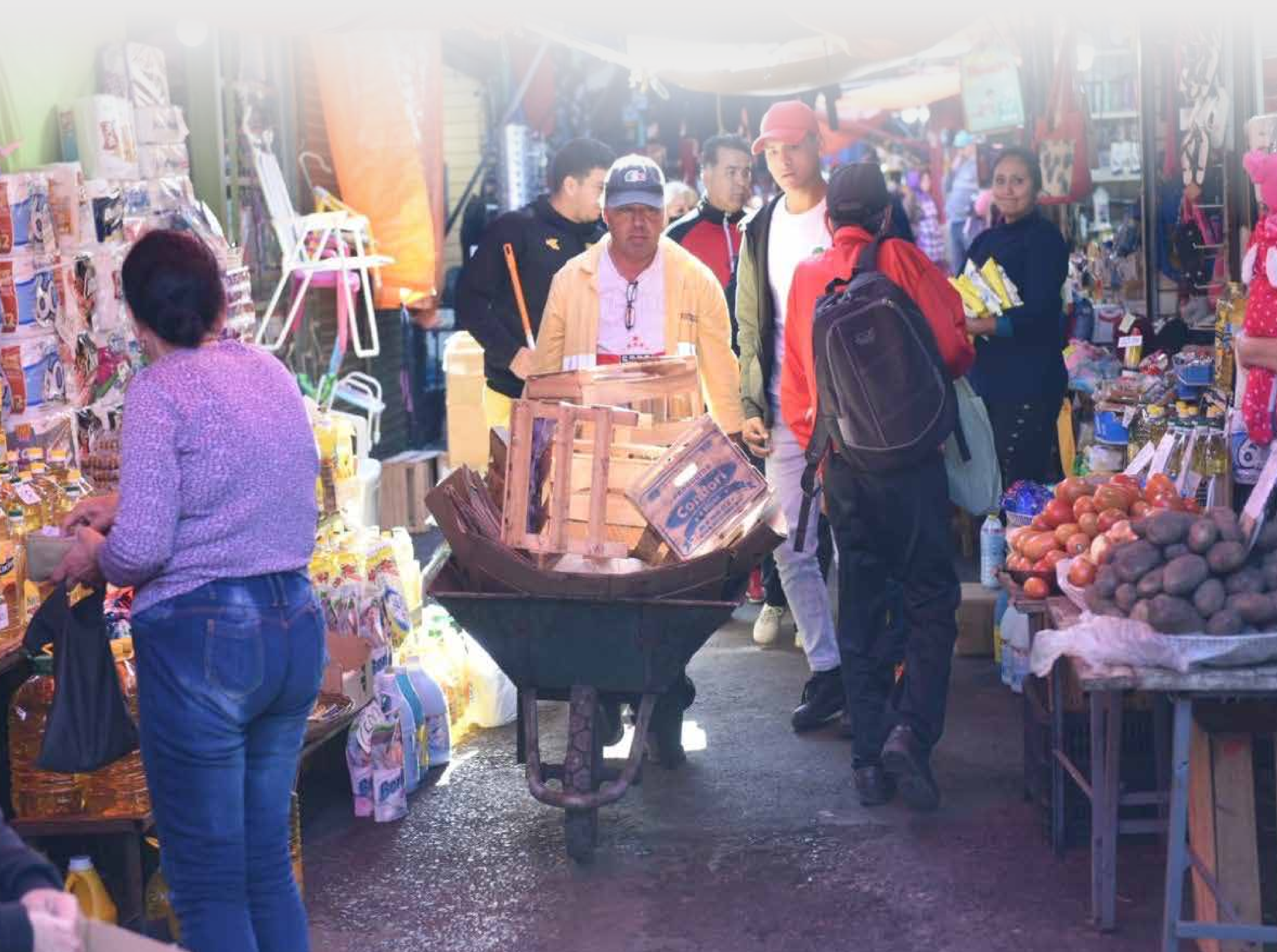
Trabajos de limpieza - Mercado 4