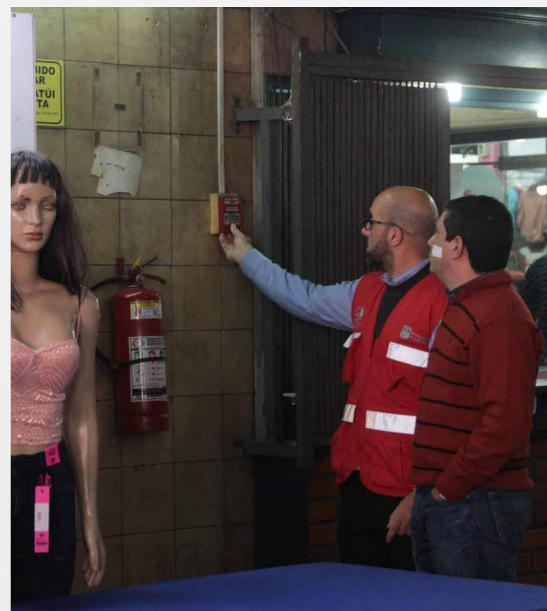
Prevención contra incendios - Mercado 4