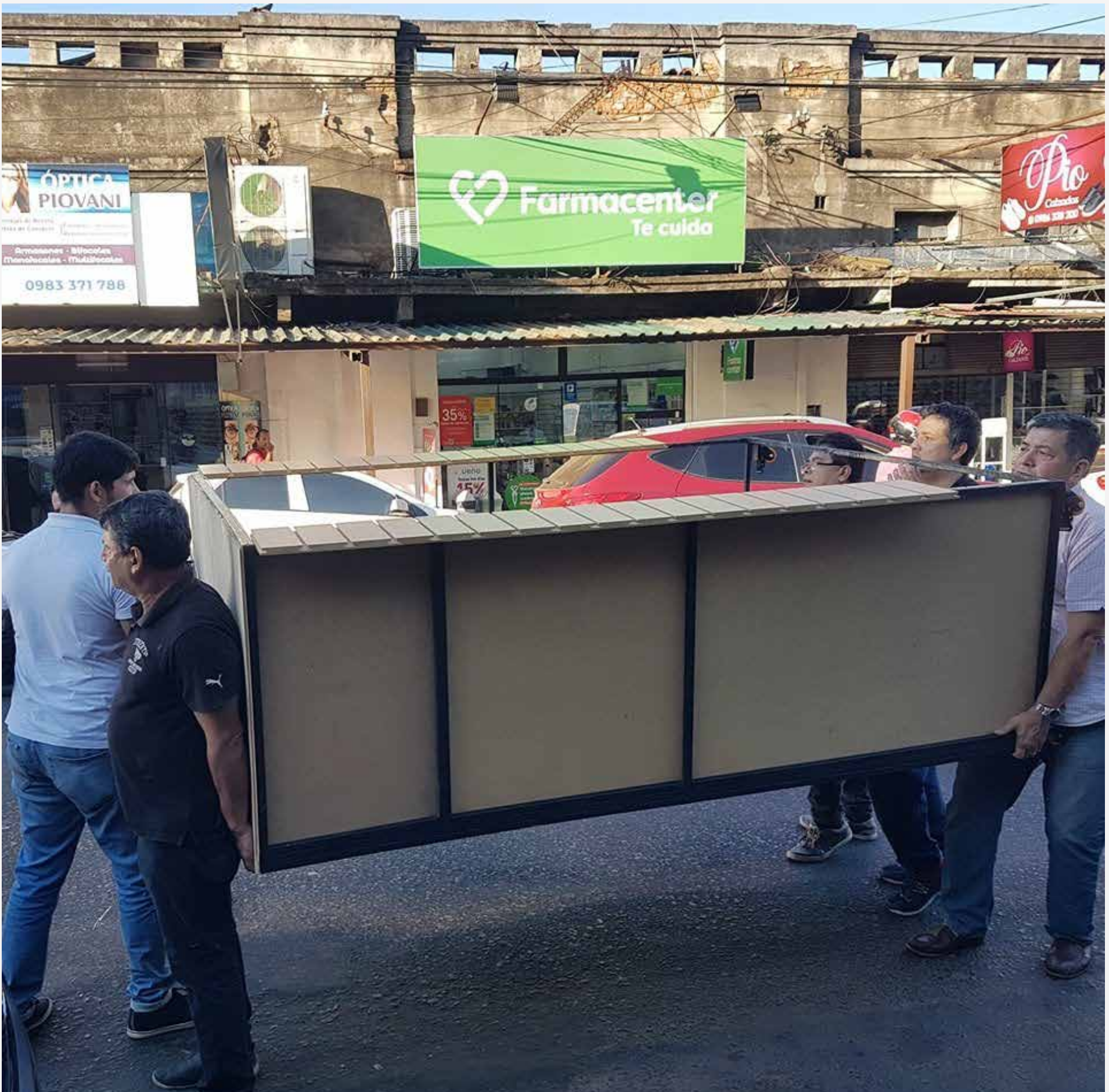
Estructuras removidas Mercado 4

Hemos pintado de amarillo los espacios permitidos para la ocupación de los puestos de ventas, a fin de otorgarles a los visitantes mayor espacio para la circulación.