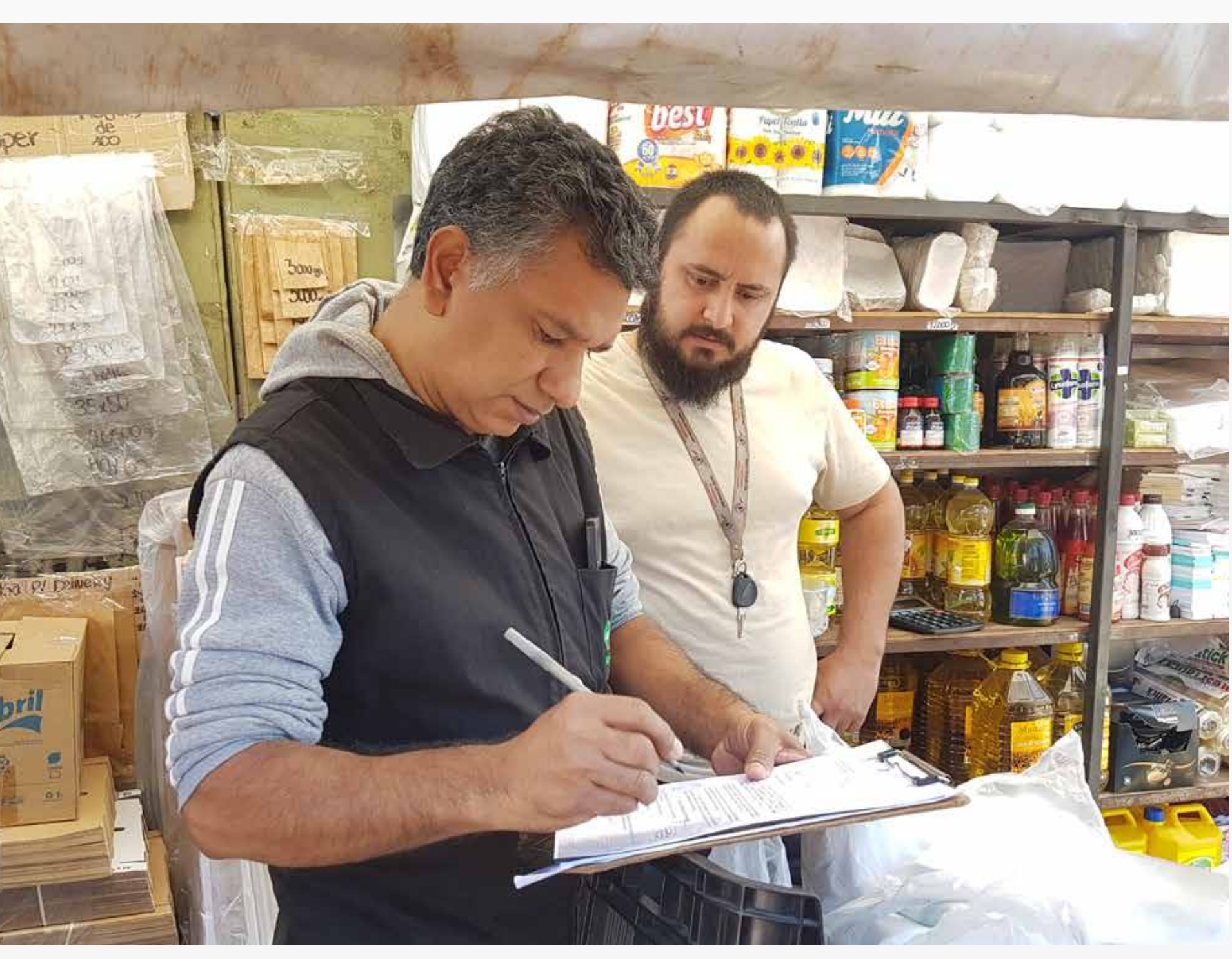
Censo de permisionarios Mercado 4

Esto se traduce en que, del 9 de noviembre de 2020 al 31 de octubre de 2021, se recaudó un total de Gs. 2.356.684.900 y del 9 de noviembre de 2021 al 31 de octubre de 2022, lo recaudado fue de Gs. 3.058.992.300 , es decir, Gs. 702.307.400 más, producto del repunte económico y de la sostenida mejora en la gestión correspondiente.