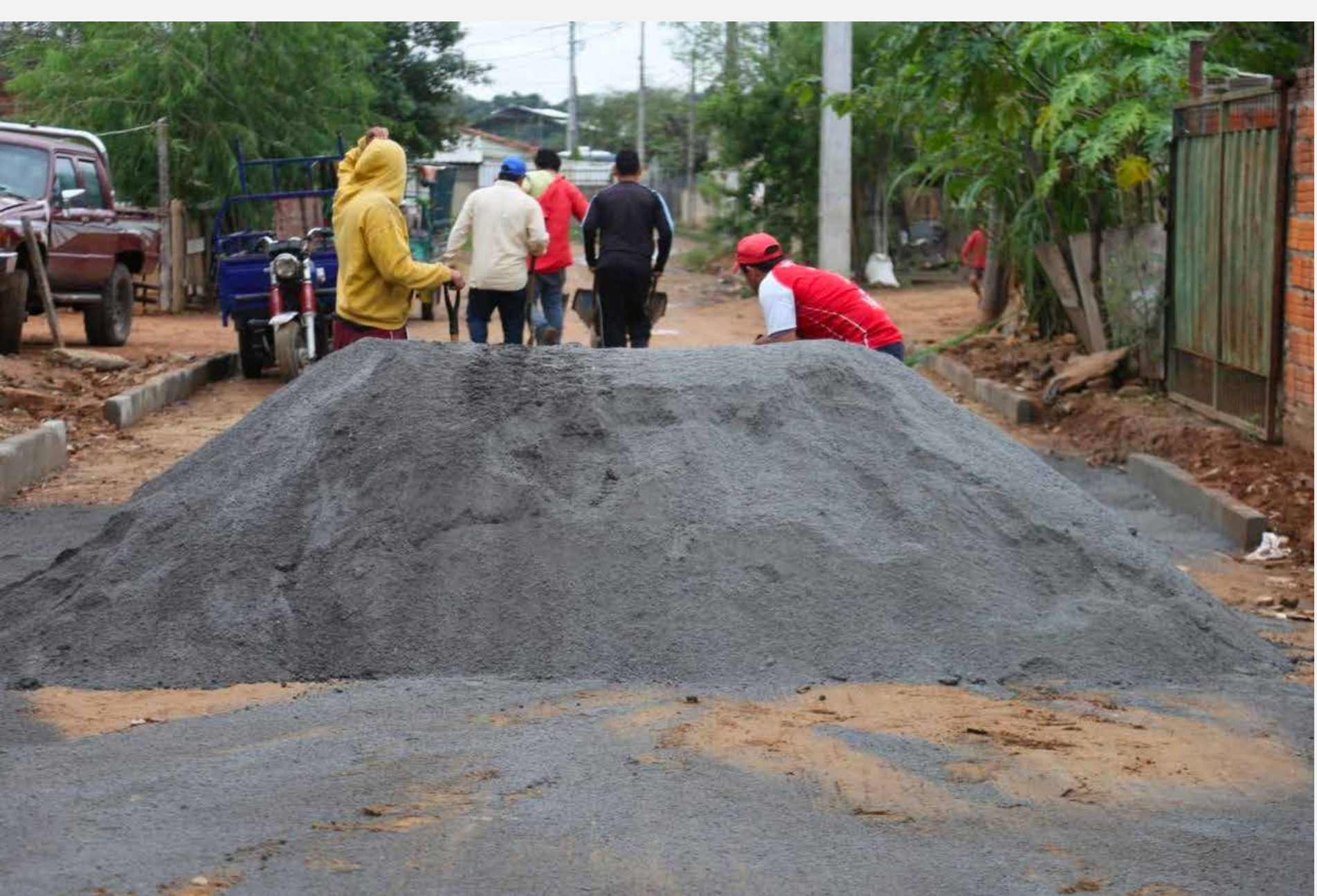
Mejoramiento Vial Barrio Santa Librada

Así también, 35 comisiones vecinales y organizaciones sin fines de lucro recibieron el segundo y tercer desembolso de fondos especiales, para conclusión de obras. Mientras que otras tres se beneficiaron con fondos para la conclusión de obras.