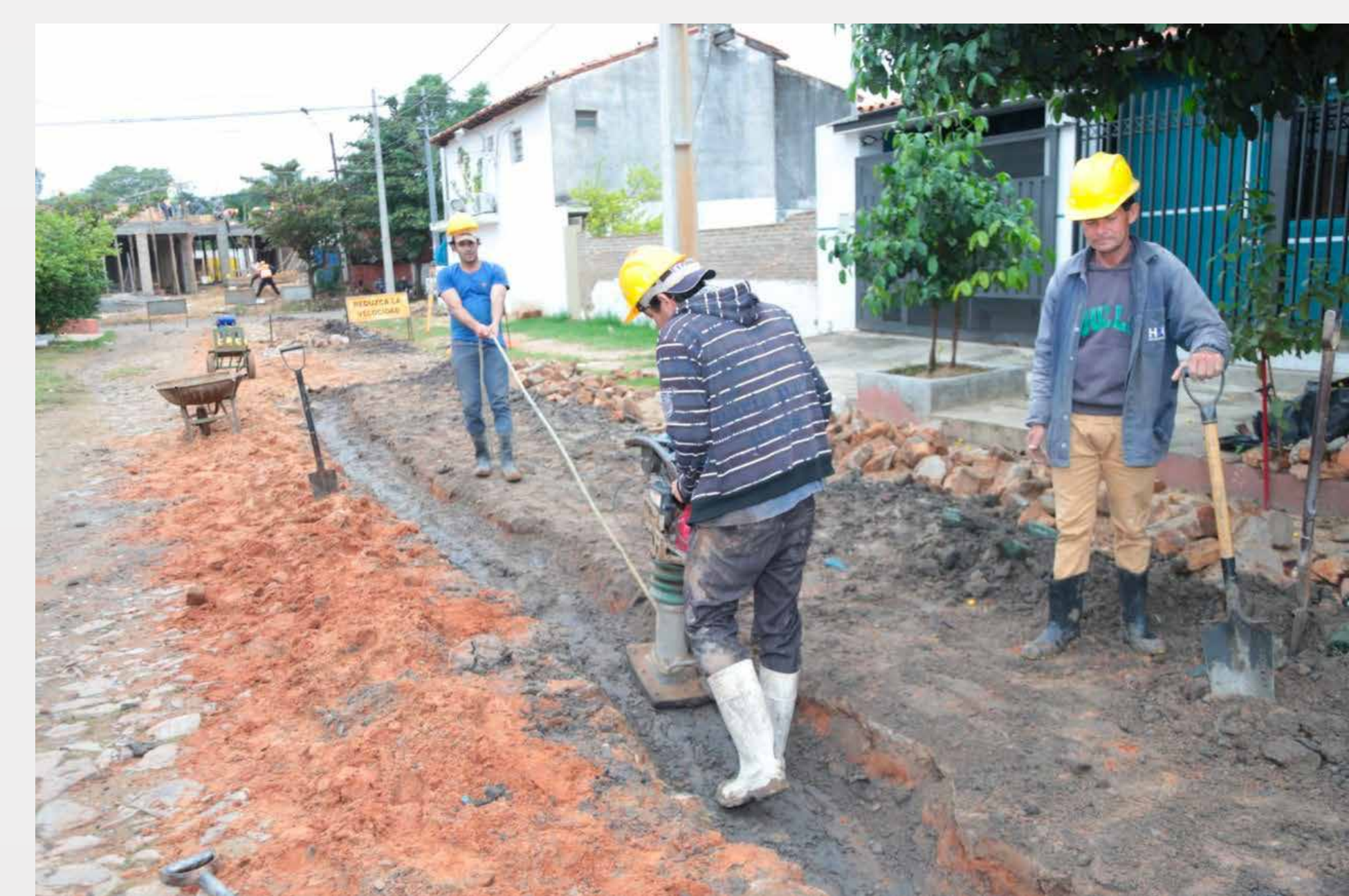
Alcantarillado Sanitario Barrio Salvador del Mundo

Entre las obras que iniciamos en los barrios Itay, Salvador del Mundo, Ita Enramada, Madame Lynch, Loma Pyta, Botánico, Santa Librada, Jara, Santa Rosa, Zeballos Cue, Tacumbú, Virgen de la Asunción, Virgen de Fátima, San Cayetano, Roberto L. Petit, Carlos Antonio López, Obrero, Tembetary, Mbocayaty, Santa María, Mburucuya, Yukyty, Las Lomas y Bañado Tacumbú,