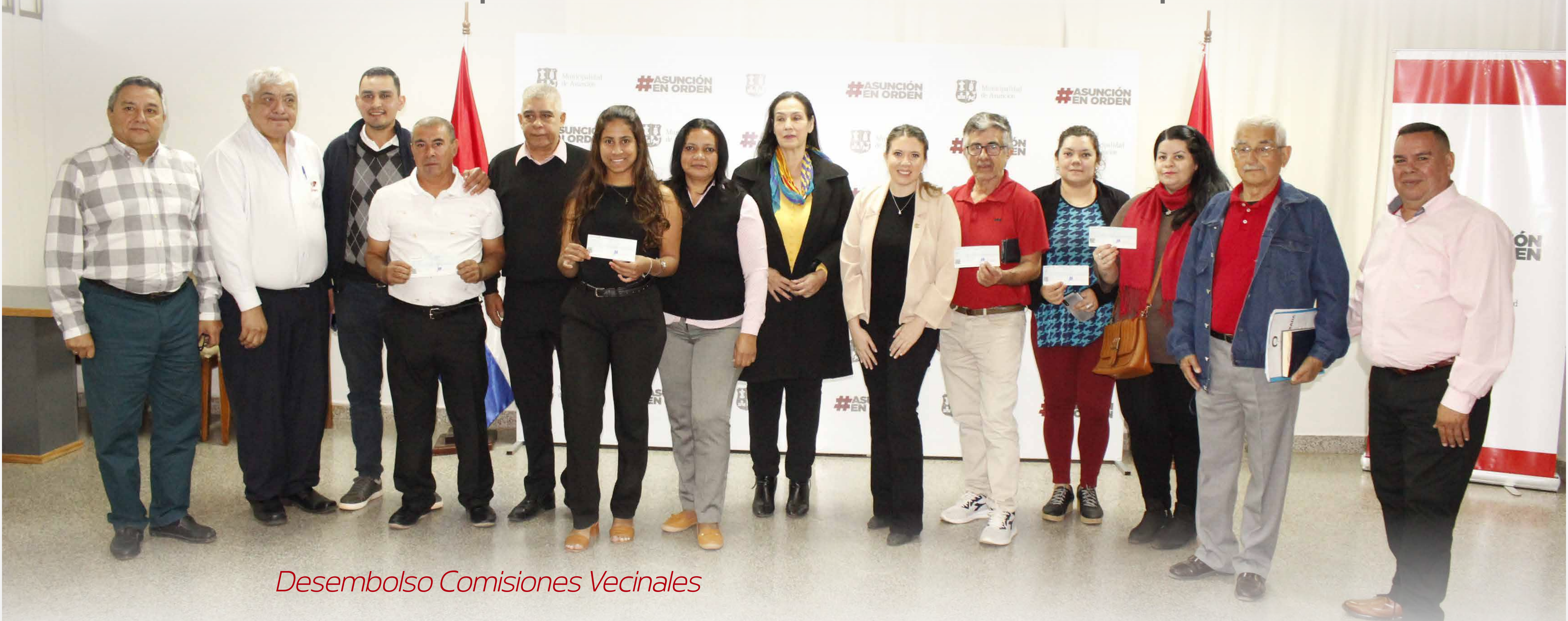
Desembolso Comisiones Vecinales

Con un total de 3.170.149.816 Gs. , transferidos por la Municipalidad, unas 85 Comisiones Vecinales se beneficiaron con el mejoramiento de la infraestructura barrial, de las cuales 47 comisiones y organizaciones sin fines de lucro recibieron el primer desembolso de estos fondos especiales.