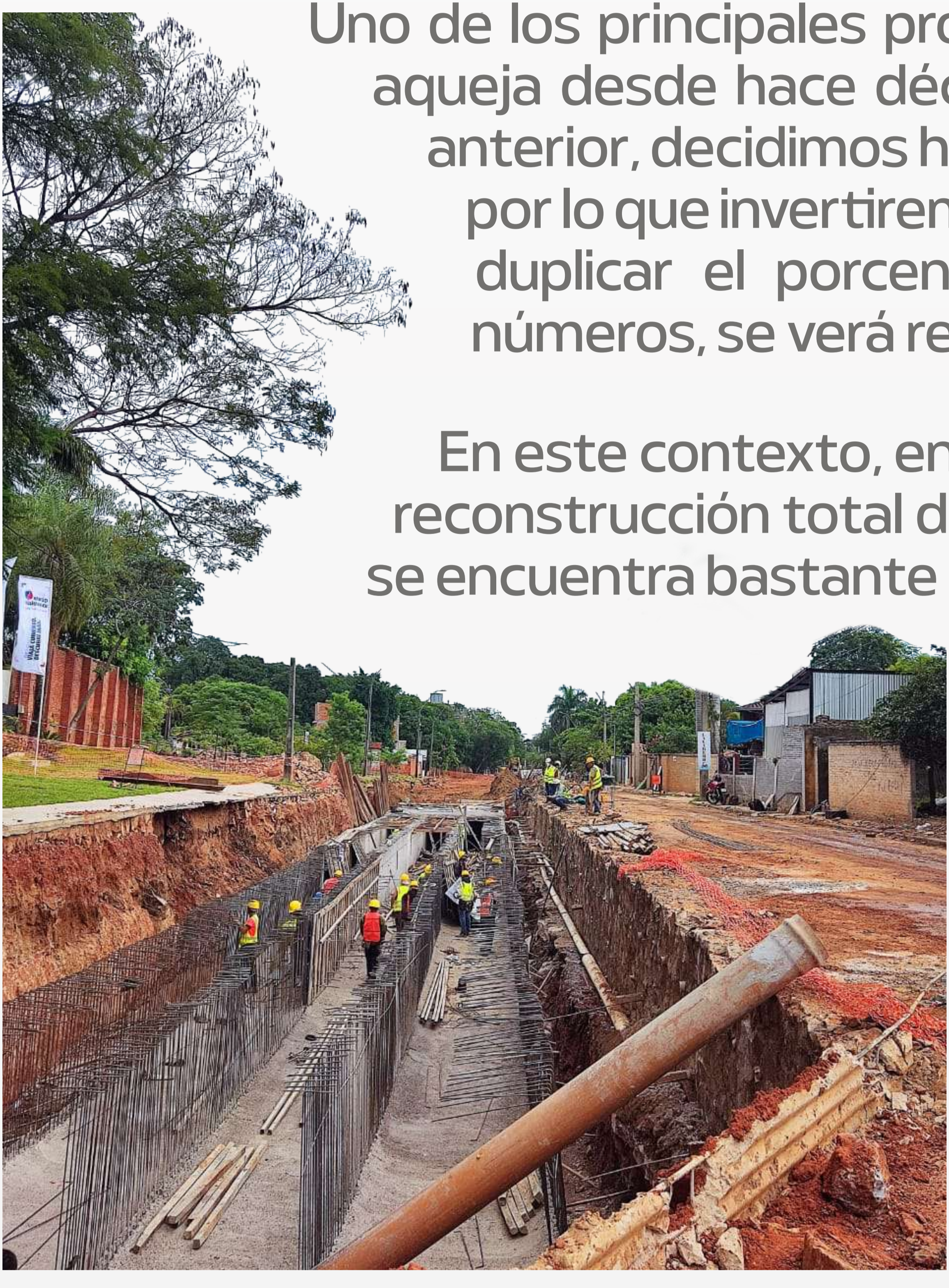
Desagüe Pluvial Molas López

En este contexto, en el 2022 continuamos con una obra titánica: la reconstrucción total de la avenida Molas López , que en la actualidad se encuentra bastante avanzada. Siguiendo esa ruta, sumamos obras como la de Isabel la Católica y otros frentes, que requerían acciones urgentes para salvaguardar la integridad de los asuncenos.