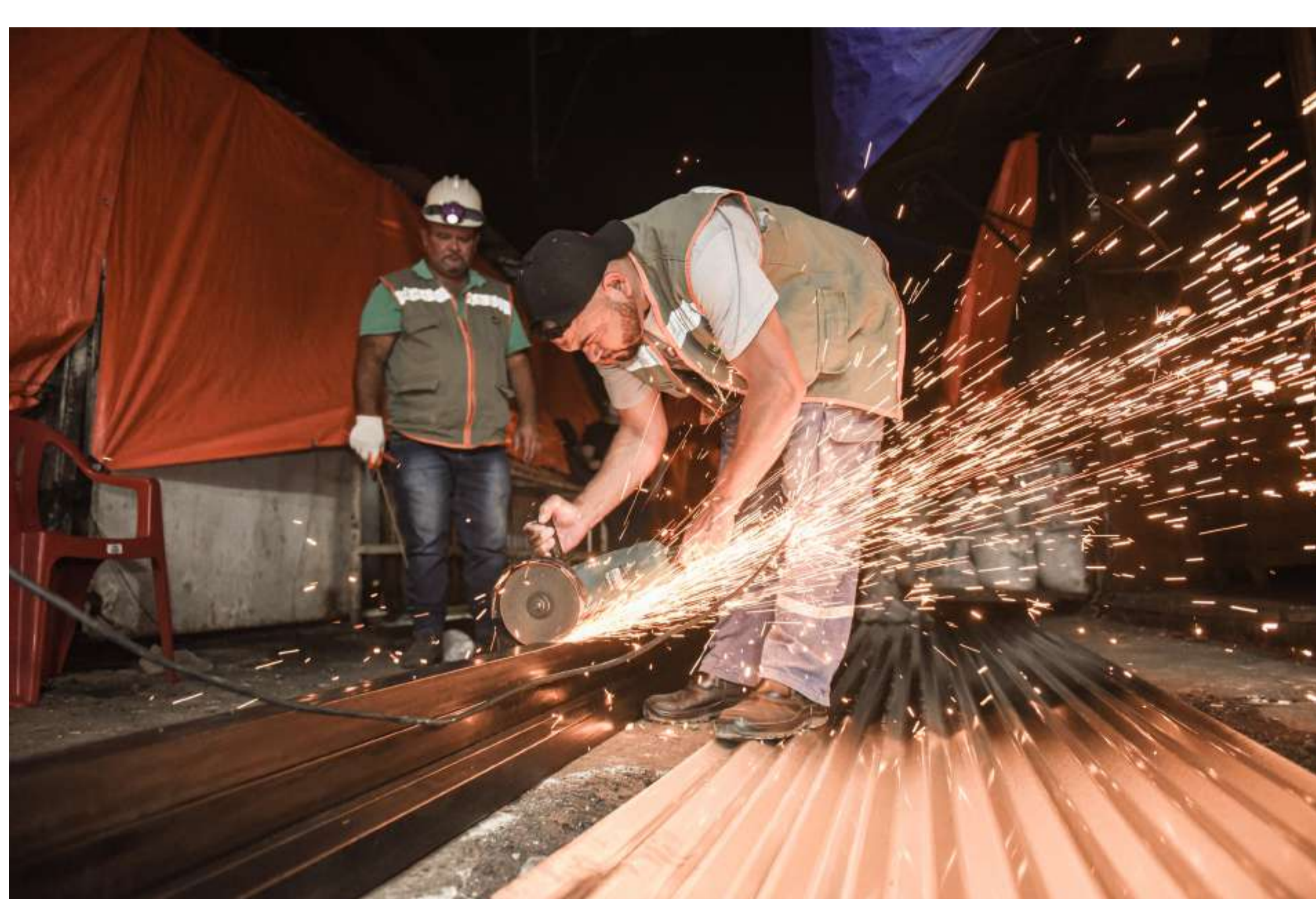
Mejoramiento de infraestructura - Mercado 4

Mediante el Convenio con Itaipú, llevamos a cabo varias acciones que conducen al mejoramiento de la infraestructura edilicia del Mercado 4. En ese sentido, hemos logrado poner de vuelta en funcionamiento el Comedor Municipal en el Bloque B, equipándolo integralmente y reacomodando a los permisionarios.