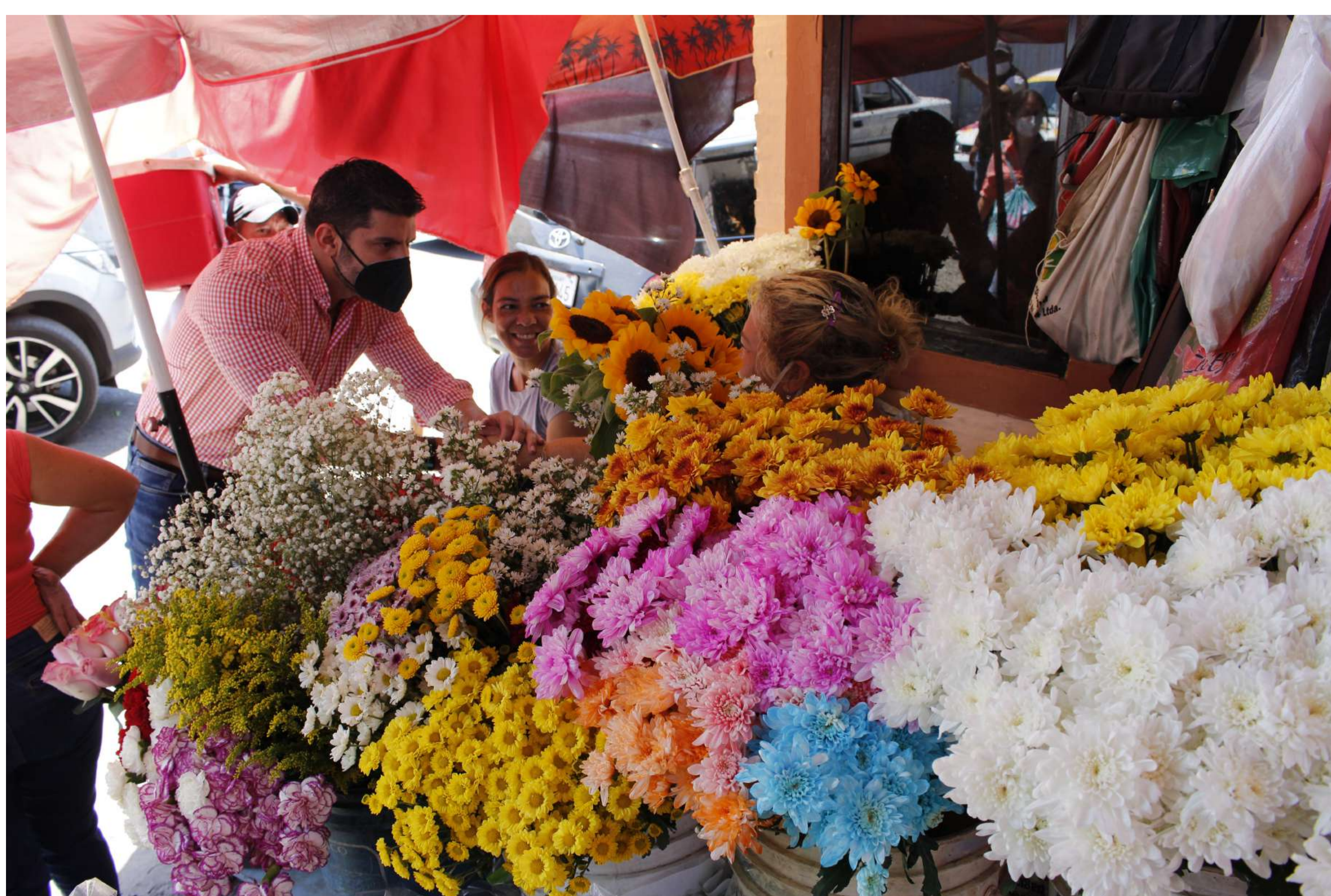
Puesto de flores - Mercado 4

Semanalmente se realizan tareas de limpieza de las rejillas de desagüe pluvial, reparamos vehículos levanta contenedores, entre otras actividades y recapamos las Calles internas del Mercado de Abasto para mejor circulación de los visitantes