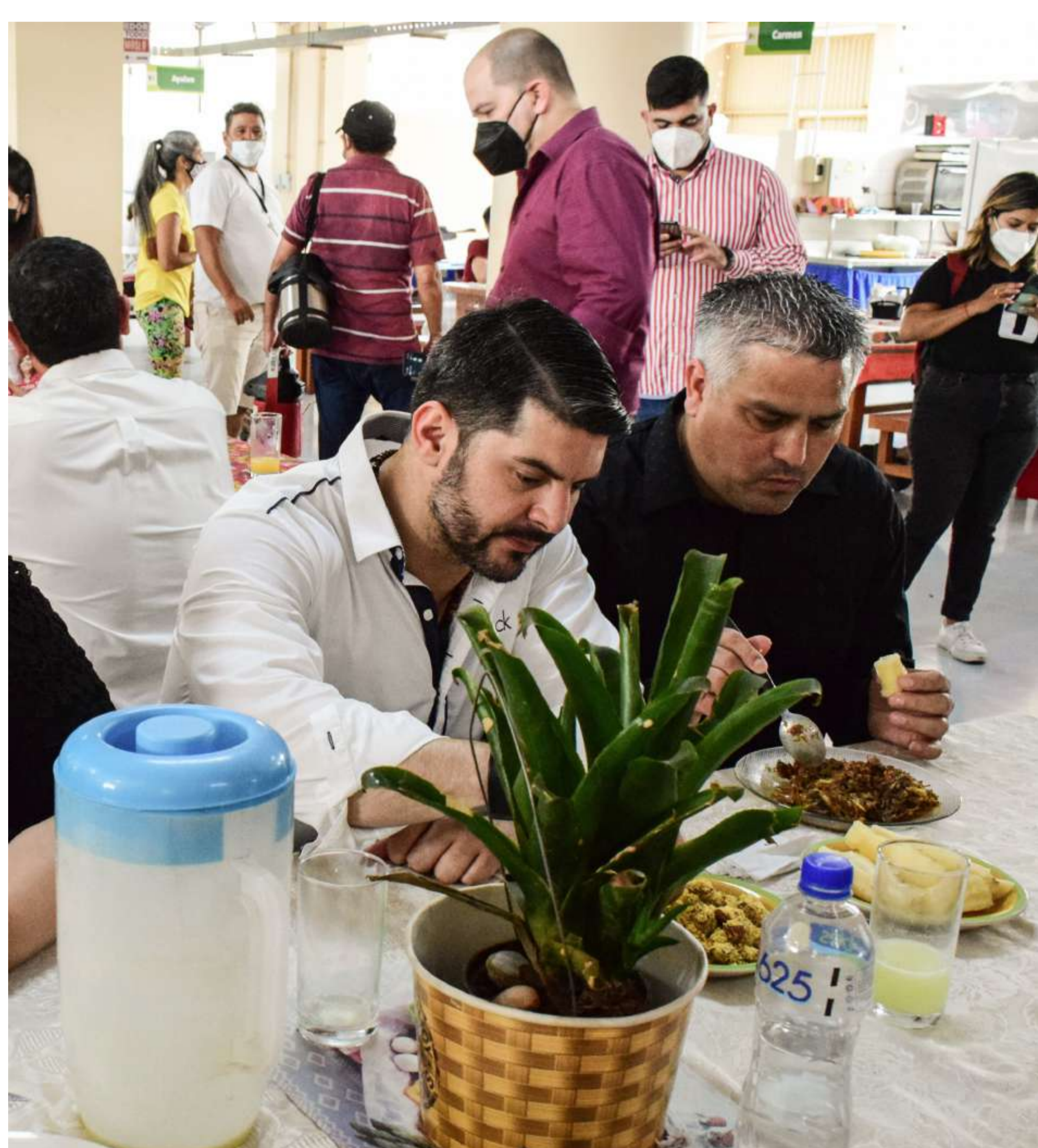
Mejoras - Comedor Municipal - Mercado 4