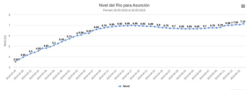
Nivel del Río para los Últimos 60 días

El actual nivel del Río se tradujo en la necesidad de evacuación de más de mil familias alcanzadas por las aguas en todos los bañados, a partir del viernes 10 de mayo. En estos momentos