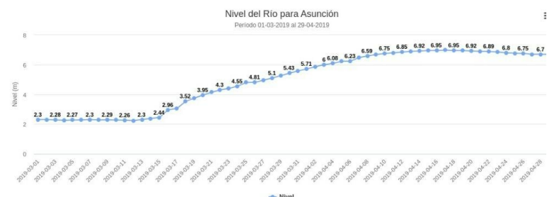
Nivel del Río para los Últimos 60 días

A la fecha, los niveles del río Paraguay, según datos de la Dirección de Meteorología de la DINAC ha disminuído 26 centímetros en 9 días tras alcanzar 6.95 centímetros el 16 de abril.