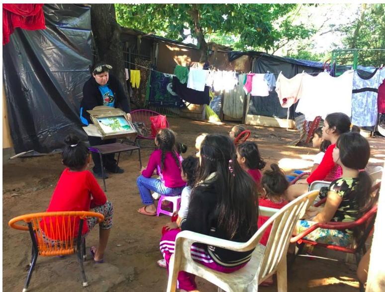
Kamicuentos en el refugio EXOPAR/CM N°10 Ñepytyvo Jovai, 24/04

“Kamicuentos”, consiste en la narración de cuentos con la técnica japonesa del Kamishibai a realizarse en los albergues transitorios. Los objetivos de esta actividad son: fomentar la capacidad de las personas para superar circunstancias traumáticas, promover los valores comunitarios y la inclusión en sus respectivas comunidades.